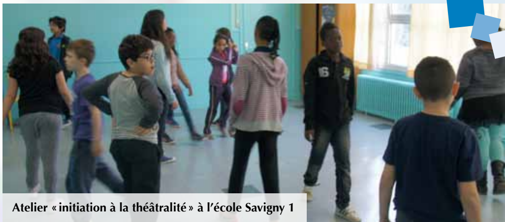
Atelier « initiation à la théâtralité » à l'école Savigny 1