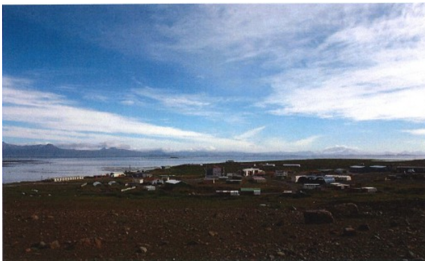
Port aux Français