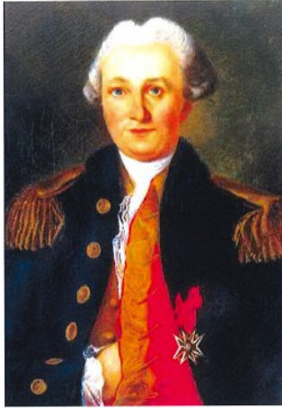
Yves Joseph de Kerguelen de Trémarec