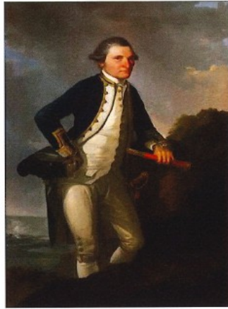
Capitaine James Cook