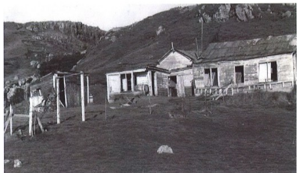
Ferme abandonnée de Port-Couvreux