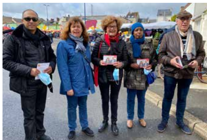
Marché de Pontlieue.