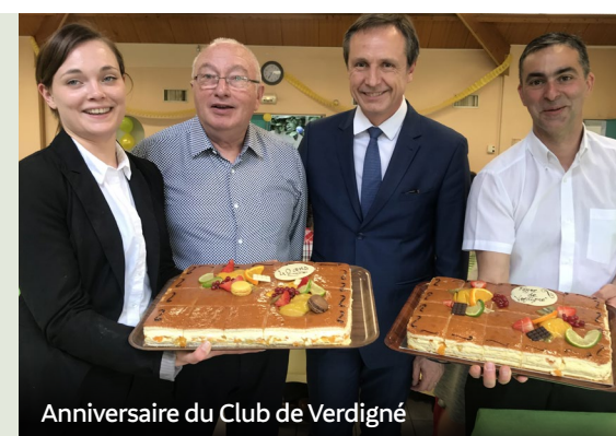
Anniversaire du Club de Verdigné