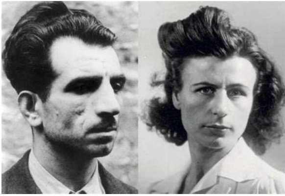
Missak et Mélinée Manouchian

Sur le plan historique, mémoriel et sur le plan des luttes. Contre le fascisme, contre la guerre, contre les politiques actuelles du gouvernement. Sans illusion aucune sur la nature de ce pouvoir de classe qui instrumentalise et salit la mémoire des communistes.