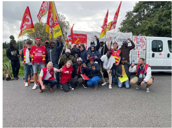
Les travailleurs d'Emmaüs sans-papiers en grève à Grande-Synthe

La division de la classe ouvrière est une des recettes du capitalisme pour maintenir ses taux de profits. Entre les hommes et les femmes, entre les français et les immigrés, entre les travailleurs régularisés et les travailleurs sans papiers, tout est mis en œuvre pour maximiser les profits, tirer les salaires vers le bas et éviter une convergence des luttes. Il est aidé en cela par des lois sur l'immigration de plus en plus restrictives et xénophobes, dont la dernière a été votée avec les voix des fascistes du RN.