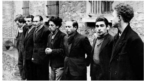
Ils seront tous fusillés... Ils étaient tous communistes.

Cela dessine un paysage politique détestable où la course se fait toujours plus à droite... La stratégie de Macron d'organiser son opposition électorale exclusive avec Le Pen, voire avec les "extrêmes" (droite et gauche) est centrale et commande pour une grande part toutes ses prises de position, y compris les plus bellicistes.