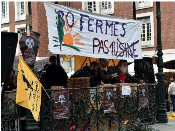
Contre la ferme usine « des milles vaches » implantée près d'Abbeville dans la Somme.

La question du « mieux vivre » qui implique un certain nombre de solutions implique de croiser et la réponse aux besoins sociaux (comme se nourrir) avec la prise en compte de normes environnementales pour, ne pas se tuer, et au travail pour les producteurs, et au repas pour les consommateurs.