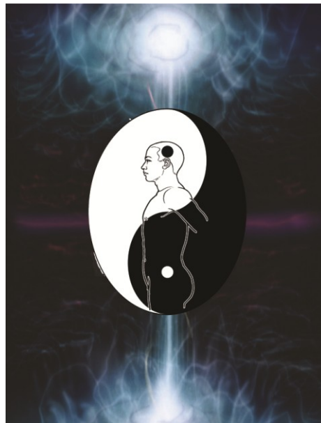
Canal Terrestre Energies QI

Notre état d'être dépend de la relation plus ou moins harmonieuse qui s'établit entre les différents niveaux vibratoires énergétiques et les différents niveaux d'échanges d'informations. Notre corps biologique est prévu à cet effet en cherchant constamment l'homéostasie des systèmes organiques. La vie est le résultat de cet équilibre précaire, jamais parfait entre deux principes que nous pouvons résumer en deux termes, la Qualité et la Quantité qui se conjuguent pour permettre la biodiversité et toutes les mutations et évolutions possibles.