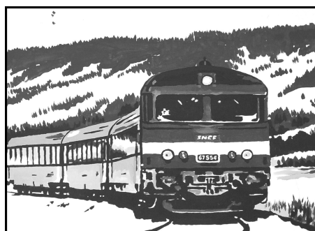
Le train, c'est quand même plus beau.

doublons : « le Département a avant tout la compétence des transports scolaires. Donc les cars assurent tous les arrêts intermédiaires, ce que ne fait pas le train ». Le son de cloche est le même en PACA, où certaines lignes express régionales (LER), mises en œuvre par la Région, verraient leur succès et donc leur intérêt en grande partie expliqué par les trajets scolaires. Notamment pour la ligne LER 29, qui double la ligne TER Marseille-Gap-Briançon sur deux portions : entre Marseille et Gap (6 doublons sur 7 circulations), et entre Gap et Briançon (7 doublons sur 11 circulations).