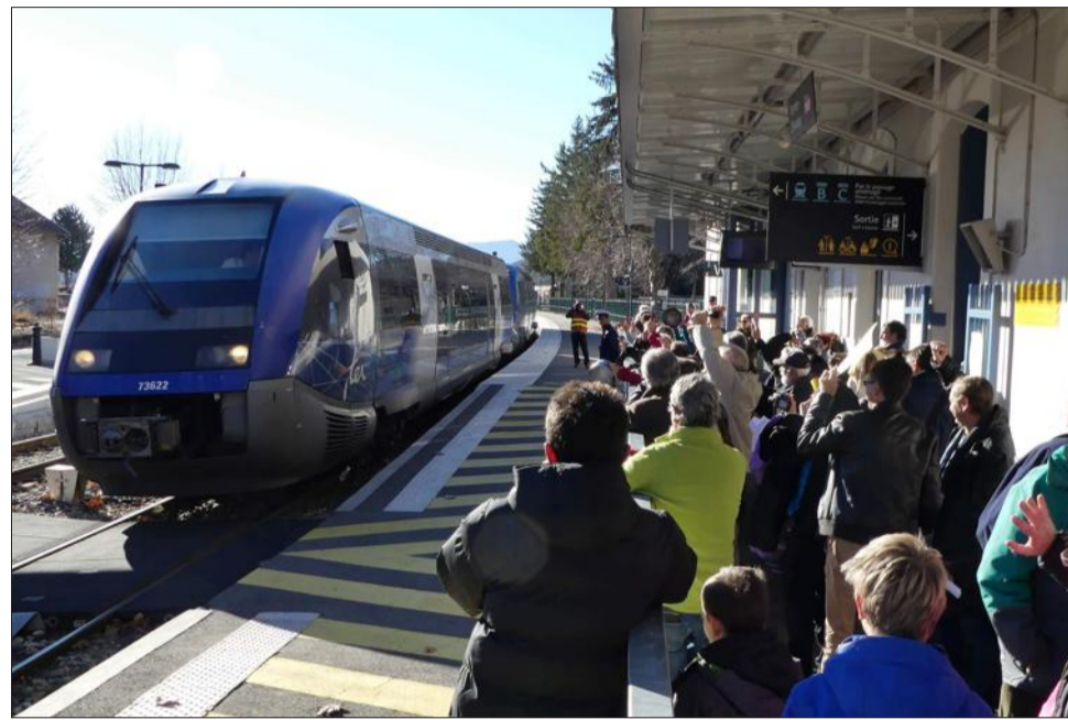
La ligne Gap-Grenoble, passant par la gare de Veynes (notre photo), fait l'objet d'inquiétudes sur sa pérennité, du fait de son état et de la baisse de sa fréquentation.

Après plusieurs heures, un communiqué commun de l'Isère et des Hautes-Alpes est envoyé : "Dans ce vœu, le Département [de l'Isère, NDLR] ne demande nullement la fermeture de la ligne Grenoble-Veynes-Gap [...] mais affiche