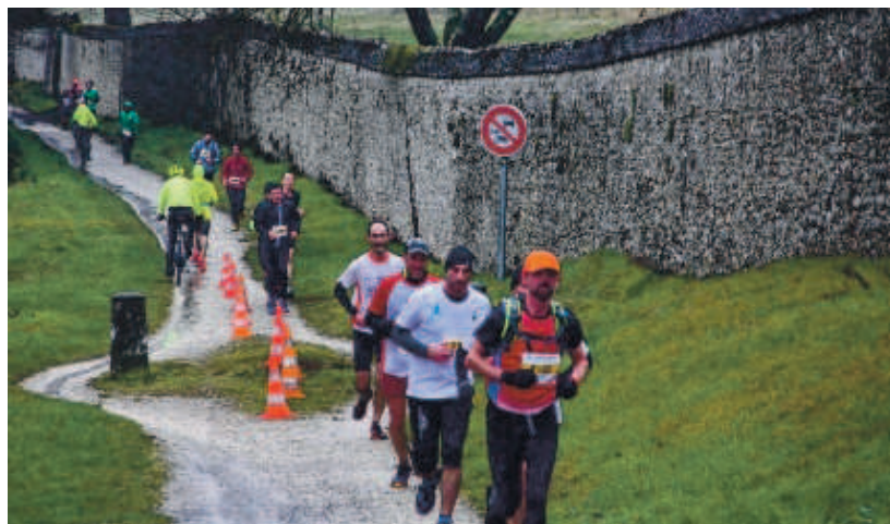
Pas loin de huit cents concurrents ont participé à cette édition 2018.