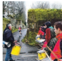
Quelques animations étaient prévues sur le parcours, ce dimanche.