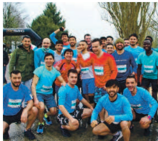
Les athlètes de l'association Pierre-Claver, qui réunit des demandeurs d'asile. L'un d'eux a fini 7 e du 10 km.