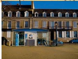
Quai des Indes