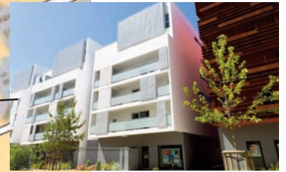
Cours de Chazelles