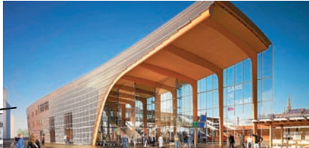
Nouvelle gare de Lorient