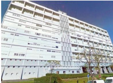
Immeuble du Moustoir