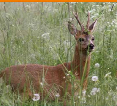
La photo du mois