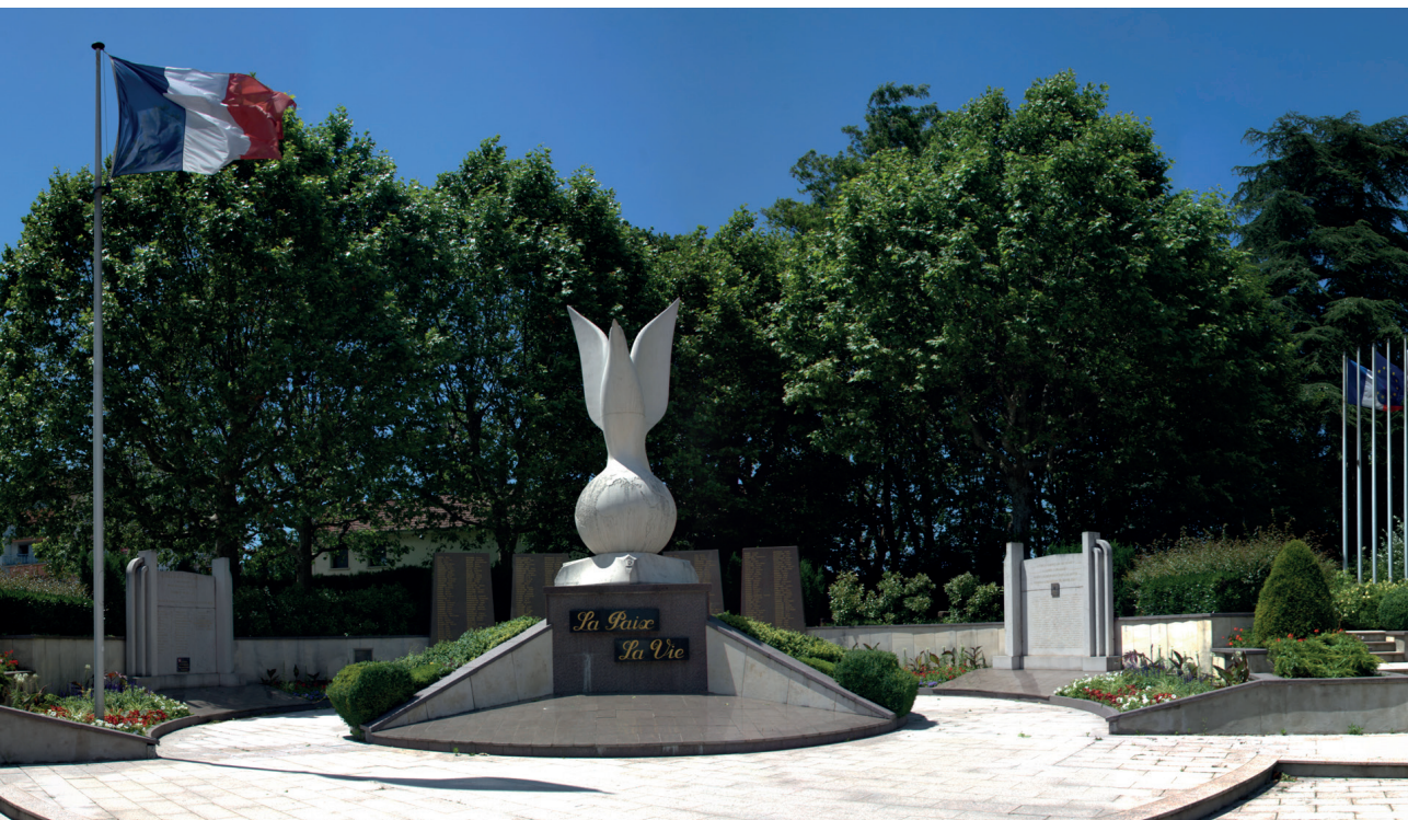
Place du Souvenir Français à Bourgoin-Jallieu, au centre de laquelle trône le Monument à la Paix et à la Vie