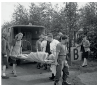
Au stalag de Sandbostel début mai 1945