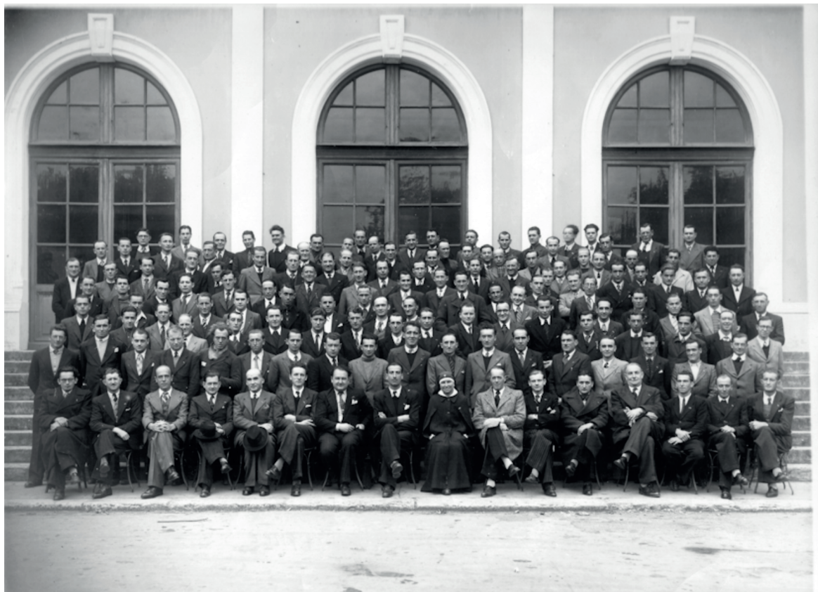
135 prisonniers de guerre du canton se retrouvent en 1956 devant la gare de Bourgoin.

« Un homme qui prive un autre homme de sa liberté est prisonnier de la haine, des préjugés et de l'étroitesse d'esprit. »