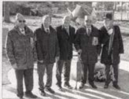
Le président national Roland Picaud a rendu hommage aux vétérans du Sahara qui ont été les pionniers des essais nucléaires

L'association du mémorial national des vétérans des essais nucléaires (qui a pour objectif le devoir de mémoire et de faire rentrer les vétérans dans l'histoire de la défense nationale) a décidé de rendre