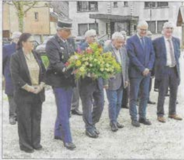
Le président national du Mémorial national des vétérans des essais nucléaires, Roland Picaud, a déposé, au pied du mémorial d'Ugine, la gerbe avec, à ses côtés, les autorités civiles et militaires.

Également ce dépôt de gerbe a eu lieu en hommage à la gendarmerie nationale dont nombre de gendarmes sont devenus au fil du temps des vétérans des expérimentations nucléaires, comme cela est le cas pour la brigade d'Ugine qui a eu dans ses rangs un militaire qui avait été affecté sur l'atoll de Mururoa en Poly-