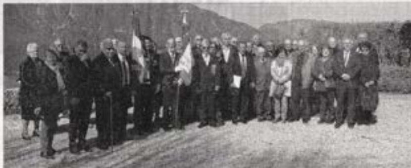
Les Vétérans des essais nucléaires se sont réunis à Tresserve pour faire le point sur l'avenir des travaux du Mémorial.

TRESSERVE. Réunis à la salle municipale de Tresserve, les vétérans des essais nucléaires de Savoie-Haute-Savoie (AINDO-VEND) ont été informés par le président national, Roland Picaud, de l'avancée de la construction de leur mémorial national dédié aux femmes et aux hommes qui ont