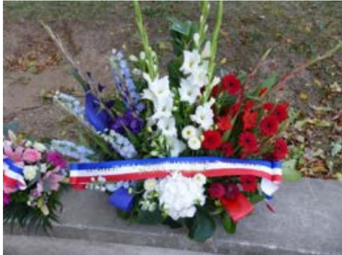
Gerbe de l'État

Cette cérémonie a été un moment essentiel de reconnaissance envers ces hommes et ces femmes, trop souvent oubliés dans les mémoires collectives, mais dont le sacrifice continue de marquer l'histoire des essais nucléaires français. Leur mémoire doit être perpétuée afin que leur dévouement et leur souffrance ne soient pas effacés par le temps.