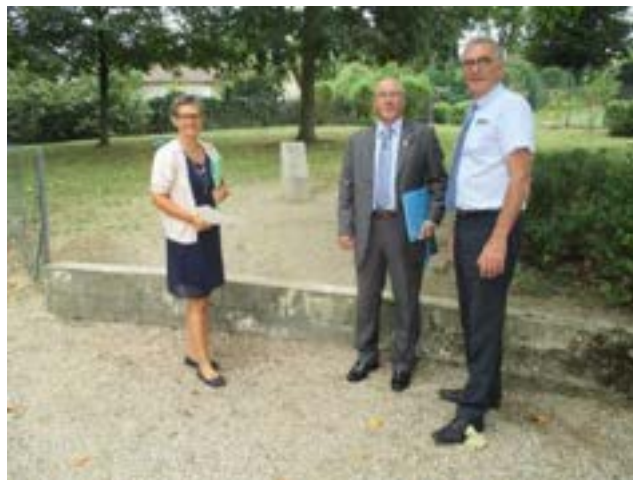
Un futur aménagement qui va mettre en valeur le mémorial