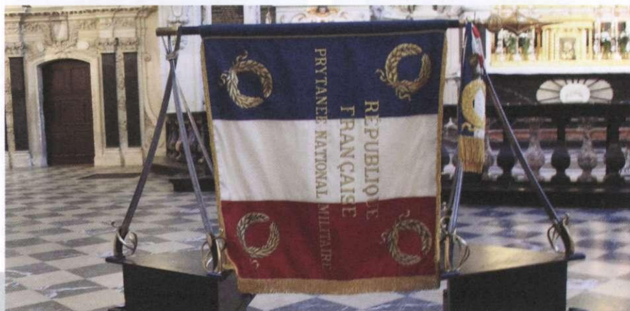
Lc 9, 43b-45 (homélie de la Présentation au Drapeau 2024). Samedi 28 septembre 2024, église Saint-Louis du Prytanée.