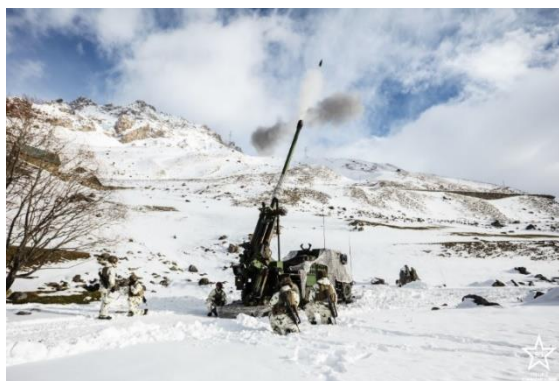
Tir d'un canon Caesar dans le GCTA

A partir de 2013, le 93e RAM est engagé dans les différentes opérations extérieures (Côte d'Ivoire, Mali, Tchad, Djibouti et Liban) avec ses principaux équipements dont le canon CAESAR. Depuis la guerre en Ukraine, il participe, avec l'OTAN, au renforcement du dispositif face à l'Est en déployant des soldats en Roumanie et en Estonie.