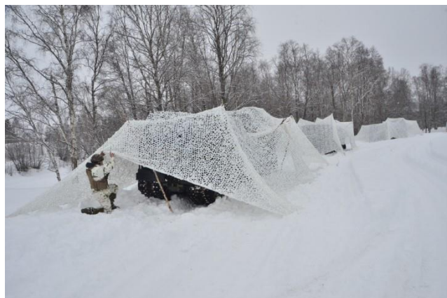
Camouflage hivernal en montagne

À la fin des années 1990, le matériel de montagne se renouvelle grâce aux matériaux composites qui allègent l'équipement et améliorent l'efficacité des vêtements individuels. Ces progrès techniques augmentent avantagement les capacités physiques et la résistance au froid des troupes de montagne. Parallèlement, le régiment s'équipe du canon 155 TRF1 en remplacement du 105 HM2.