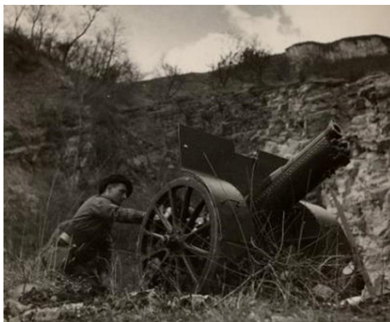
Canon de 75 de montagne en 1939

Après le conflit, la réorganisation de l'armée française entraîne la restructuration de nombreux régiments ; le 93 e RAM devient le seul régiment d'artillerie de la 27 e Division d'Infanterie. Il est équipé du canon 75 de montagne Schneider qui, décomposable en sept charges de 110 kg, est transportable sur bât à dos de mulet. L'adoption de canons courts allège la masse des pièces ce qui permet les progressions en montagne et en terrain accidenté dépourvus de route. En 1939, le 93 e RAM est subordonné à la 64 e Division d'Infanterie qui défend la frontière des Alpes. Interdisant le franchissement des massifs montagneux aux Italiens, l'armée des Alpes parvient également à empêcher l'armée allemande d'entrer dans Grenoble en l'arrêtant dans la vallée de l'Isère à Voreppe. Invaincu, le régiment dépose les armes à l'armistice de 1940 puis est dissous.