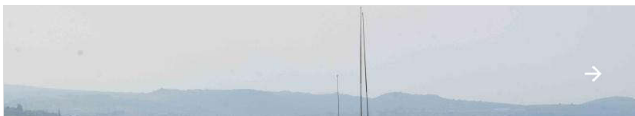
DAMAN - Transfert d'autorité de la FCR, le régiment d'infanterie chars de marine succède au 3e régim