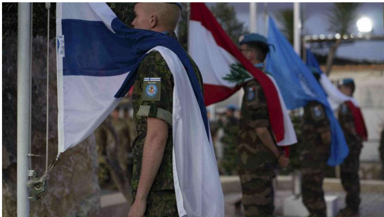
DAMAN - Transfert d'autorité de la FCR, le régiment d'infanterie chars de marine succède au 3e régim