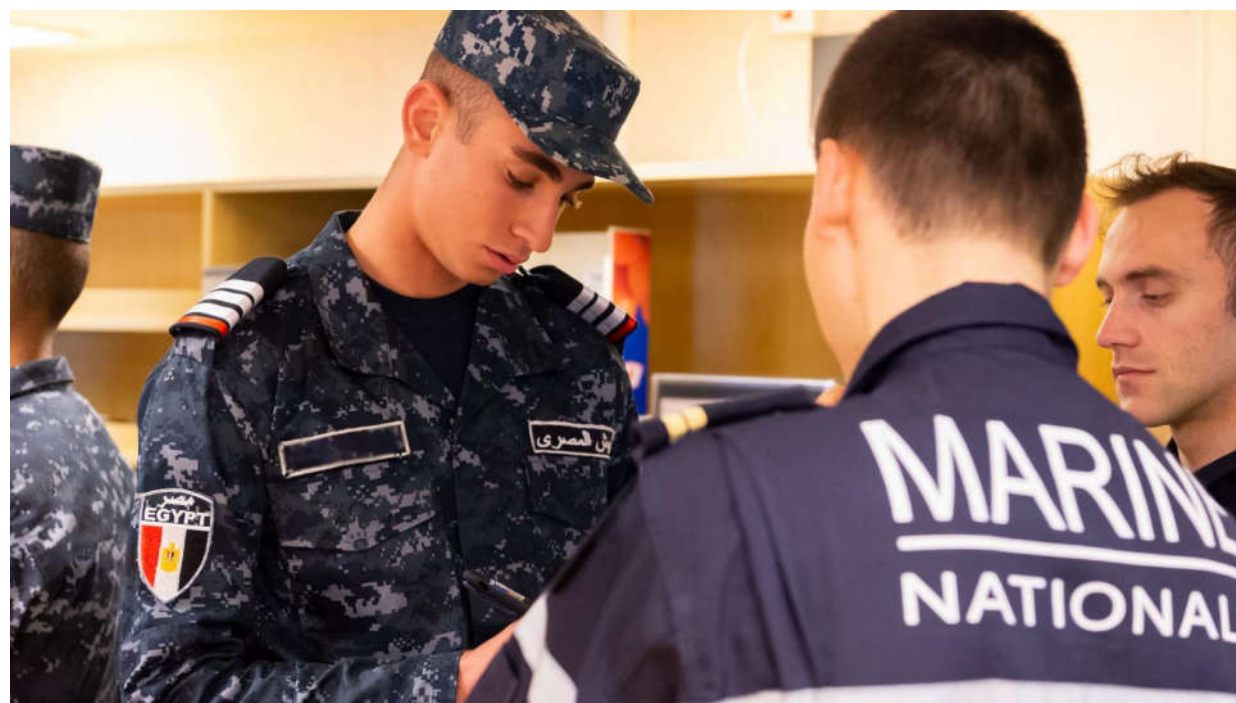
Première activité d'interopérabilité du groupe effectuée avec la marine égyptienne