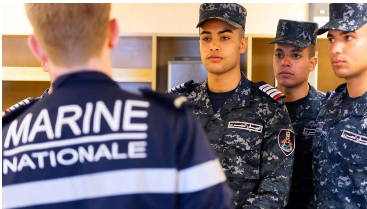
Première activité d'interopérabilité du groupe effectuée avec la marine égyptienne