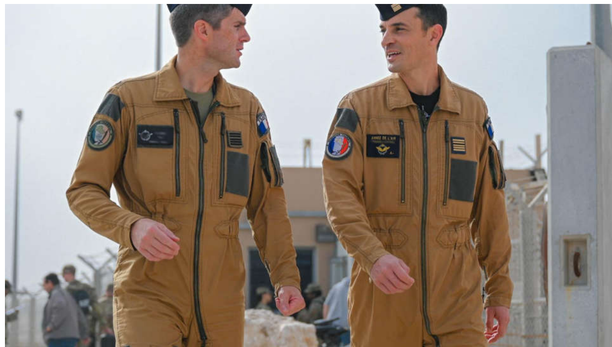
CHAMMAL – Relève du SNR au CAOC