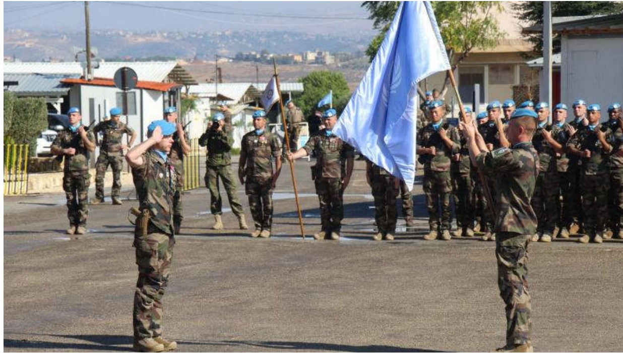
Transfert d'autorité pour la Force Commander Reserve au Liban