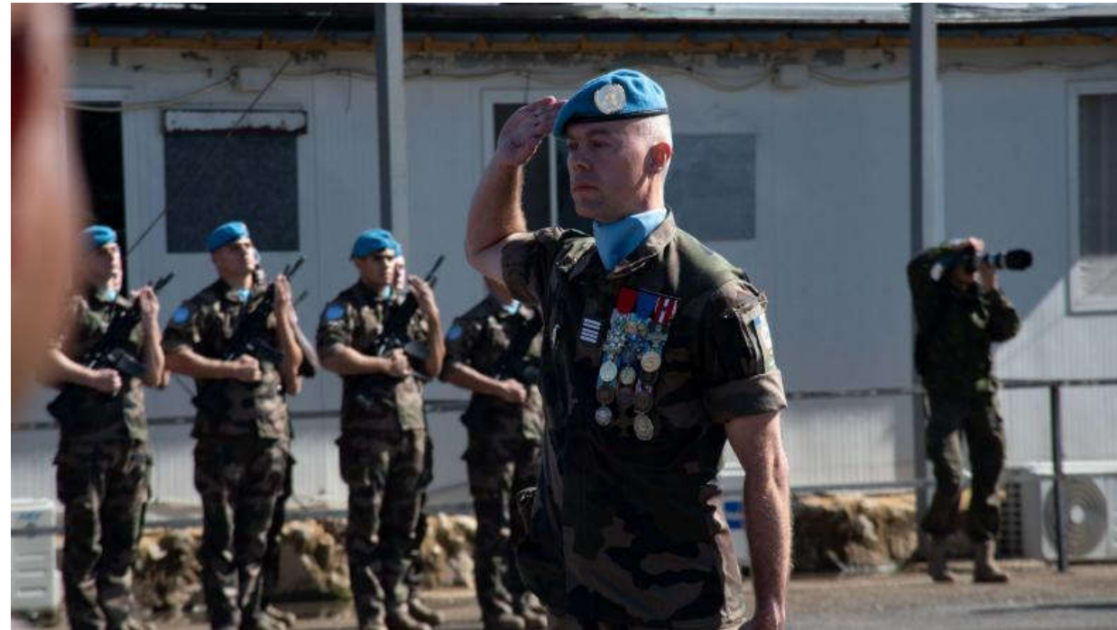
Transfert d'autorité pour la Force Commander Reserve au Liban