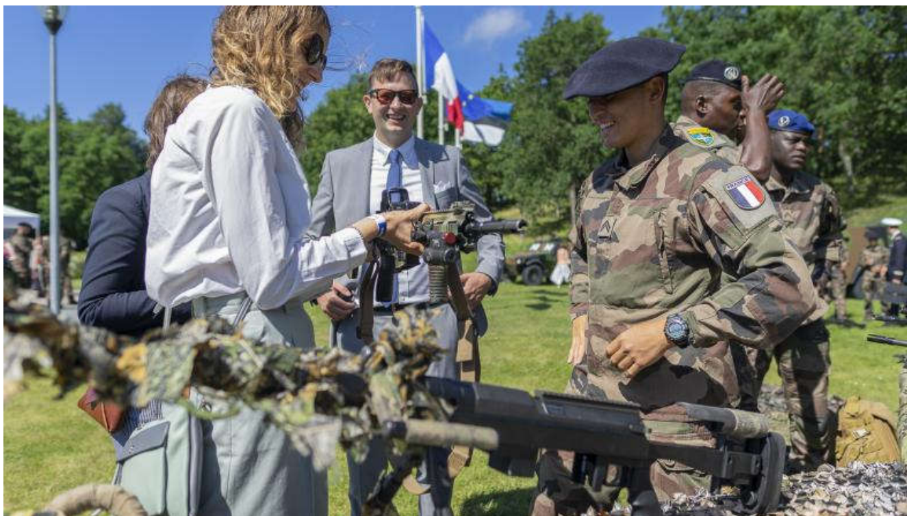
Les détachements français déployés en Estonie et en Roumanie célèbrent le 14 juillet

Les cérémonies organisées en Estonie et en Roumanie à l'occasion de la fête nationale du 14 juillet ont permis aux militaires français engagés sur le flanc est de l'Europe de partager des moments de convivialité avec leurs alliés