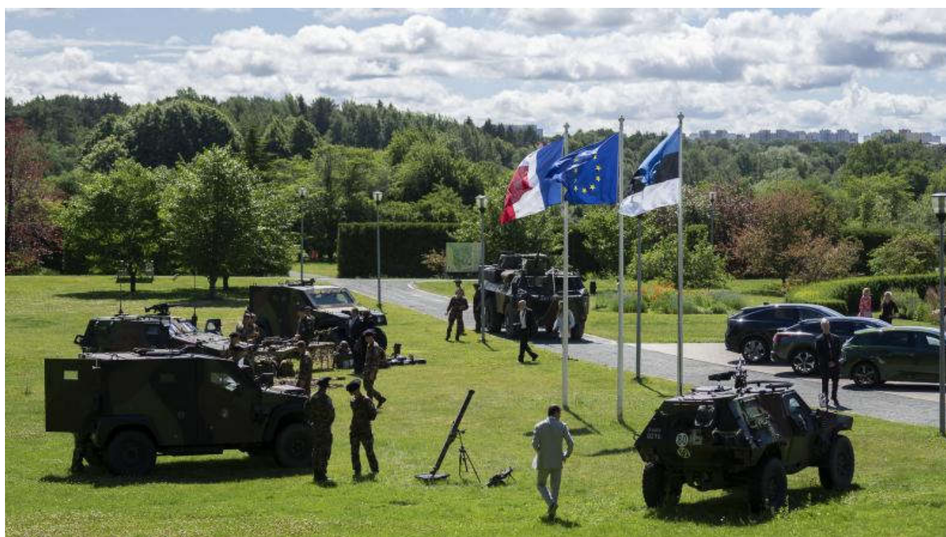
Les détachements français déployés en Estonie et en Roumanie célèbrent le 14 juillet