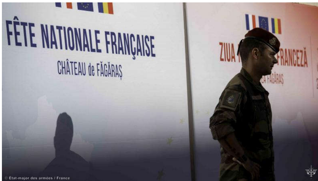
Les détachements français déployés en Estonie et en Roumanie célèbrent le 14 juillet