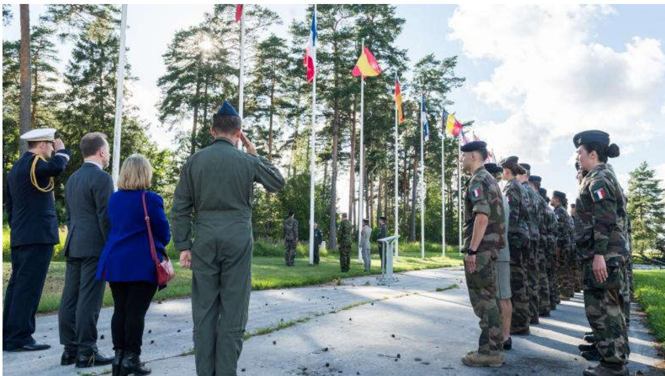
Les détachements français déployés en Estonie et en Roumanie célèbrent le 14 juillet