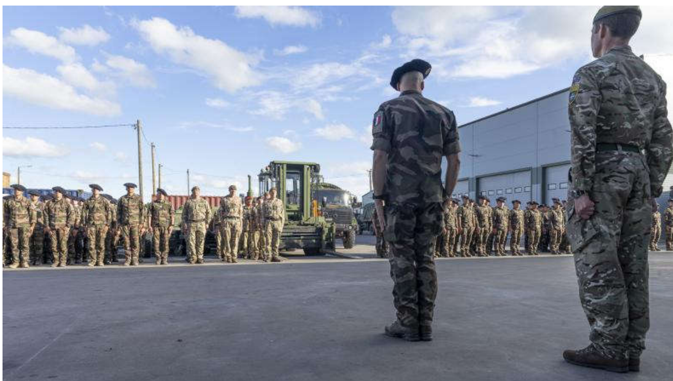
Les détachements français déployés en Estonie et en Roumanie célèbrent le 14 juillet