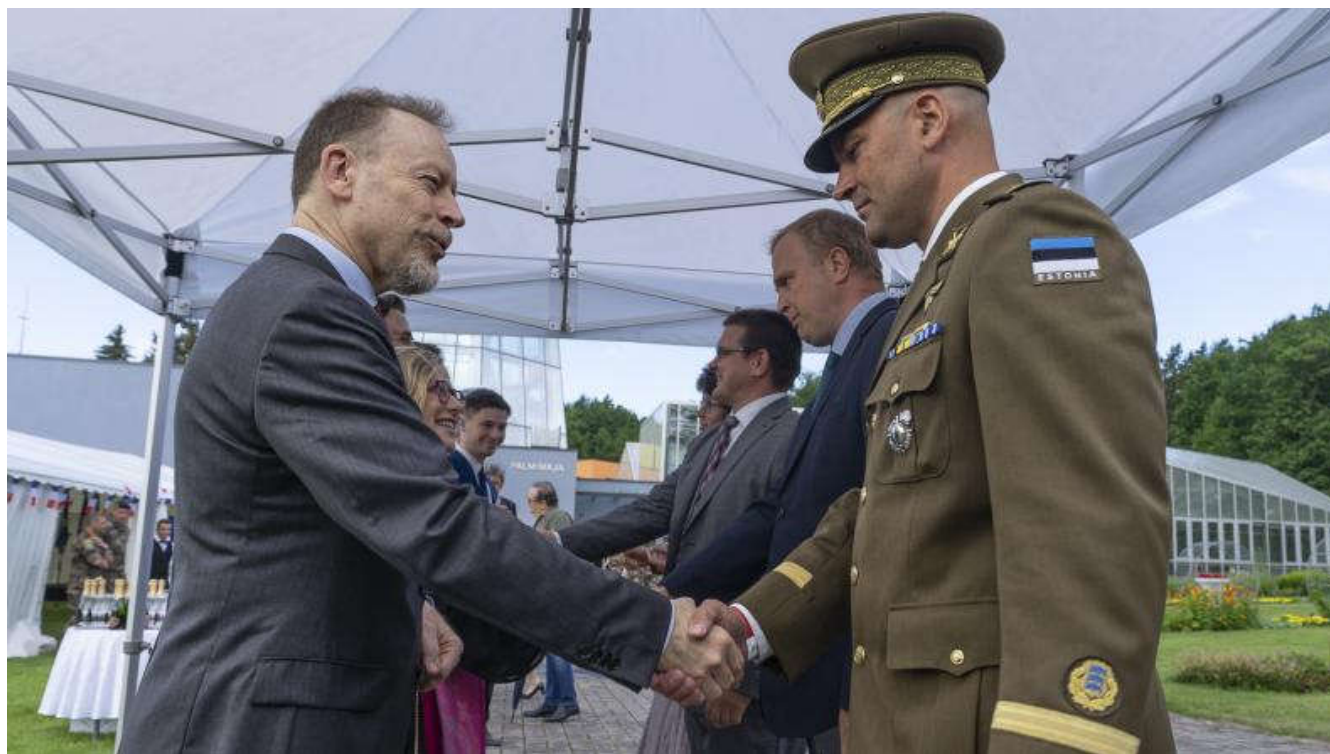
Les détachements français déployés en Estonie et en Roumanie célèbrent le 14 juillet