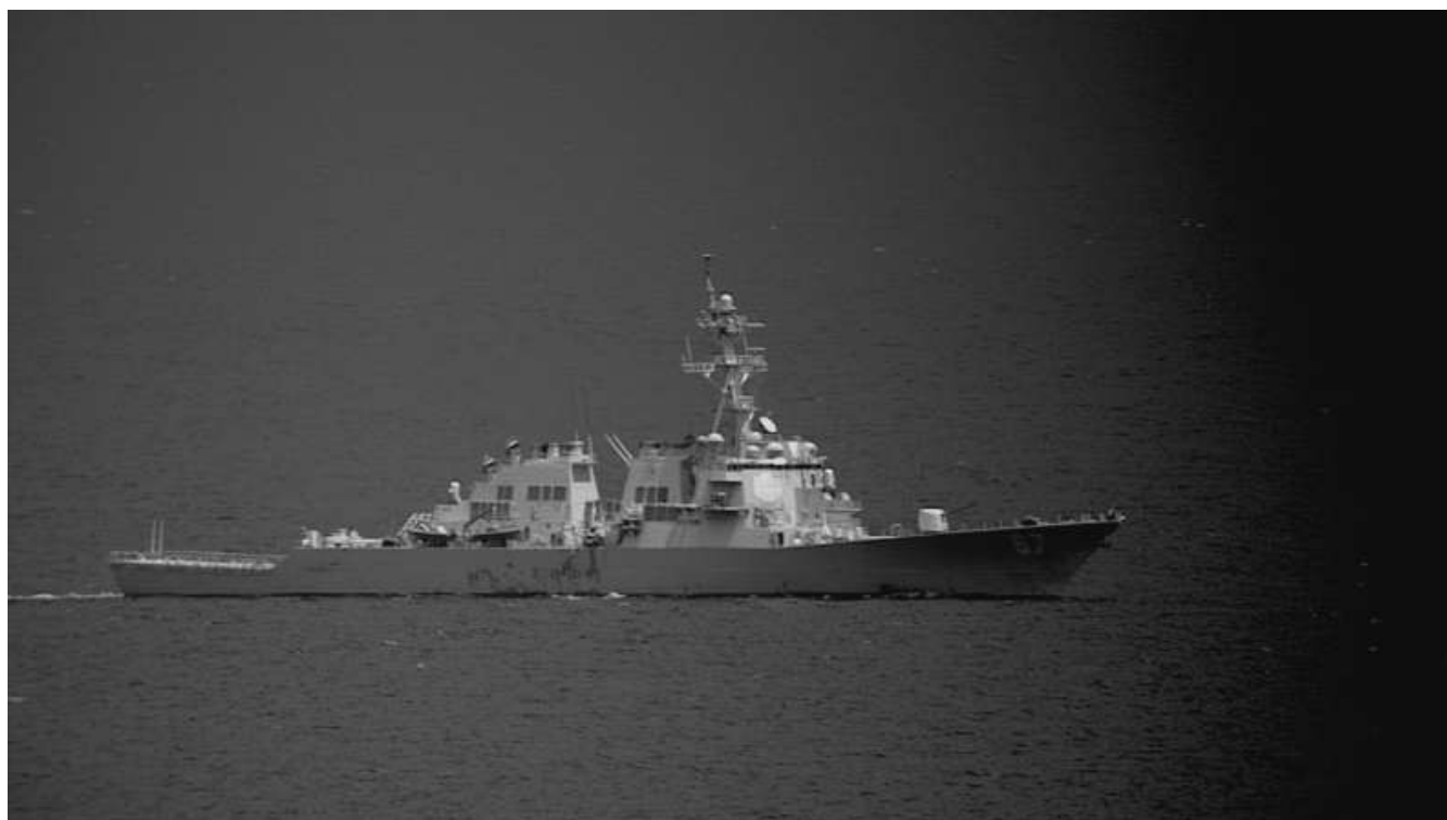
Entraînement interalliés à la chasse au sous-marin pour le détachement Atlantique 2 de La Sude

La rénovation du système d'armes des ATL2 a débuté fin 2013 pour une première livraison en 2019. Cette opération comprend le traitement des obsolescences critiques du système de combat, ainsi que la restauration de ses performances. 18 appareils seront rénovés sur la période de la LPM (2019-2025), au lieu des 15 initialement prévus. La première capacité opérationnelle a été prononcée en décembre 2020. Les performances des nouveaux capteurs sont très bonnes et le saut capacitaire en lutte anti-sous-marine est très significatif, en particulier pour la détection passive.