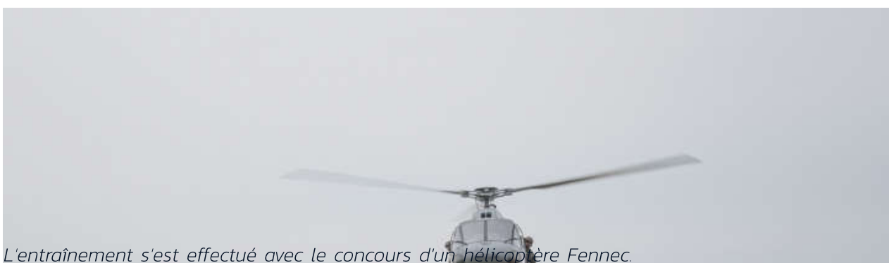
L'entraînement s'est effectué avec le concours d'un hélicoptère Fennec.

À l'occasion de leur venue, ils ont pu échanger et s'entraîner avec l'escadron de protection, de jour et de nuit. Sur deux jours, ils ont effectué plusieurs exercices et ont élaboré ensemble différents scénarios, comme l'interception d'un véhicule avec recherche d'un fugitif ou une embuscade avec un groupe armé terroriste retranché dans le chenil.