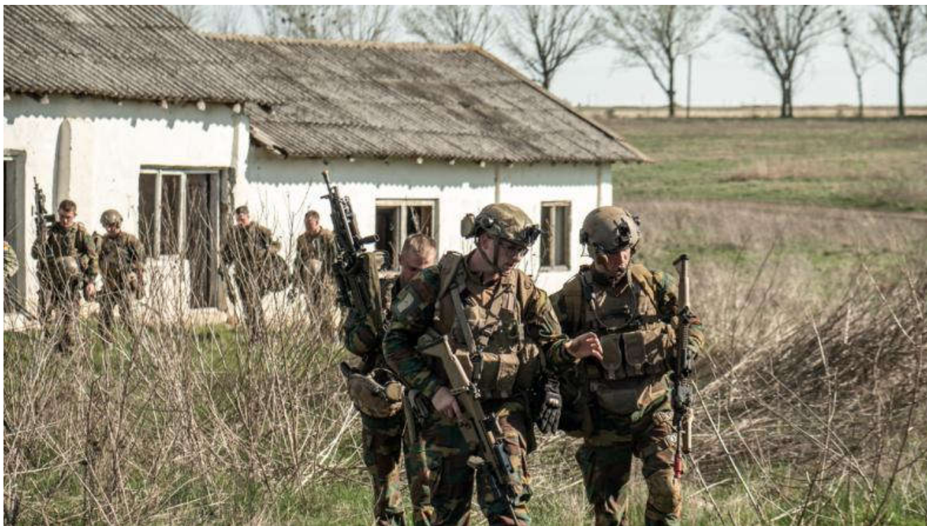
AIGLE - Entre interopérabilité et haute intensité -