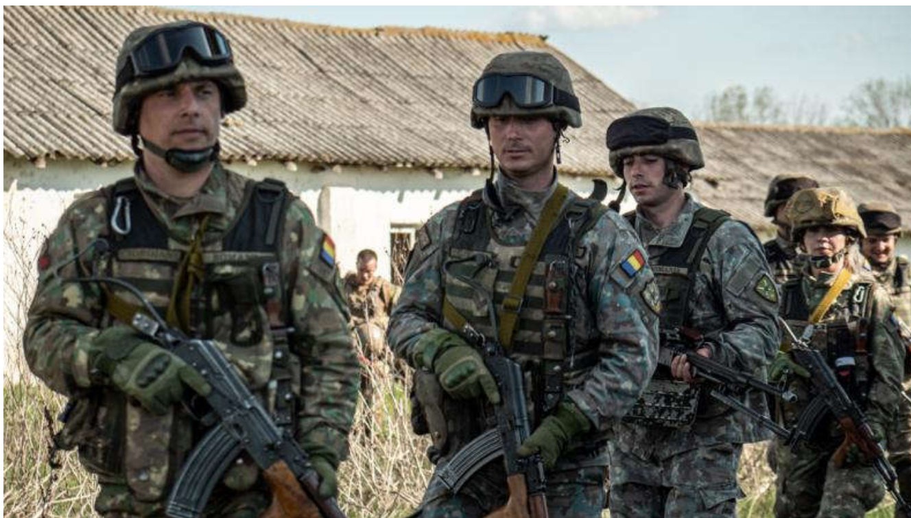
AIGLE - Entre interopérabilité et haute intensité -