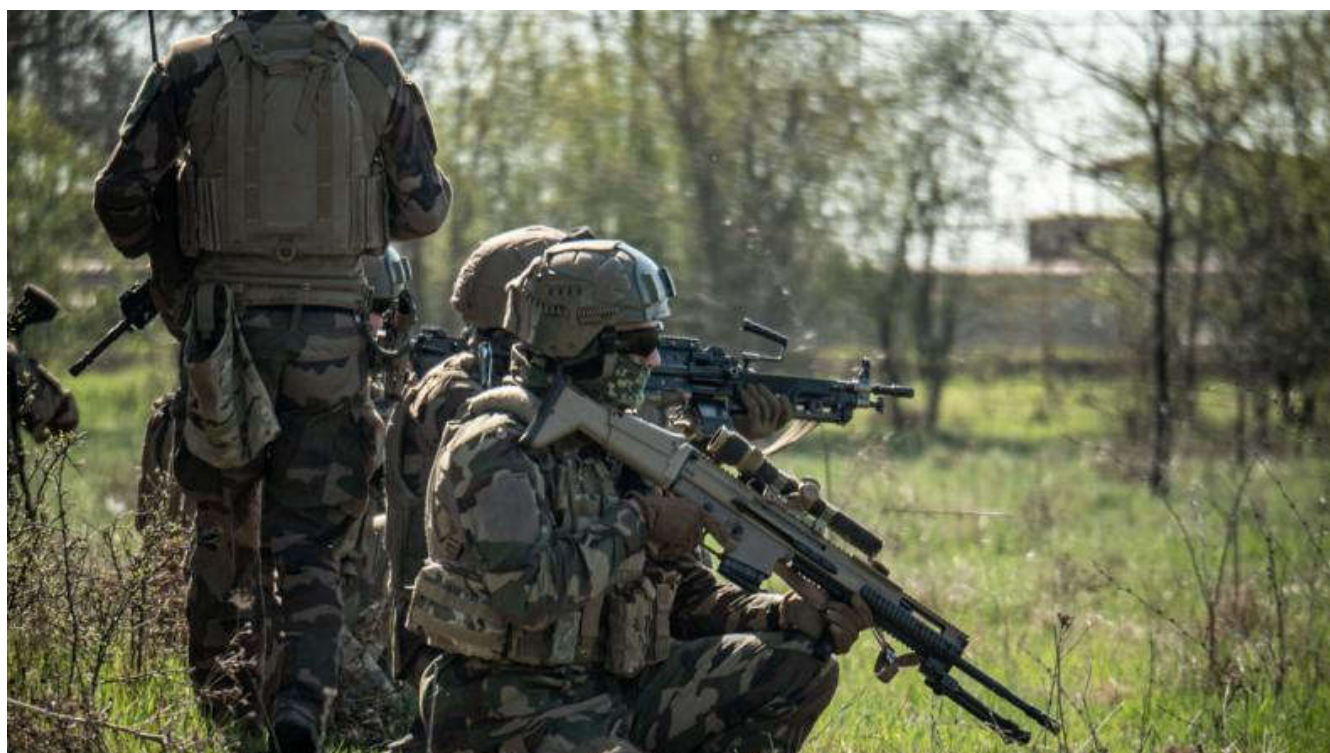
AIGLE - Entre interopérabilité et haute intensité -

En avril, les soldats du Spearhead Battalion , désormais déployés sur différentes entités militaires en Roumanie, ont réalisé une série d'exercices interalliés mettant en œuvre des scénarios de combat de haute intensité.