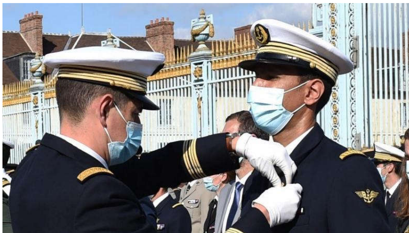
Cérémonie de remise des brevets de l'Ecole de guerre à l'Ecole militaire, 2021 -

Délivrée à l'issue de leur parcours de formation, cette certification permet aux officiers brevetés de l'Ecole de guerre de valider leurs compétences au plus haut niveau dans le référentiel national des compétences professionnelles (RNCP). Les officiers brevetés obtiennent la qualification d'« expert en management, commandement et stratégie ».