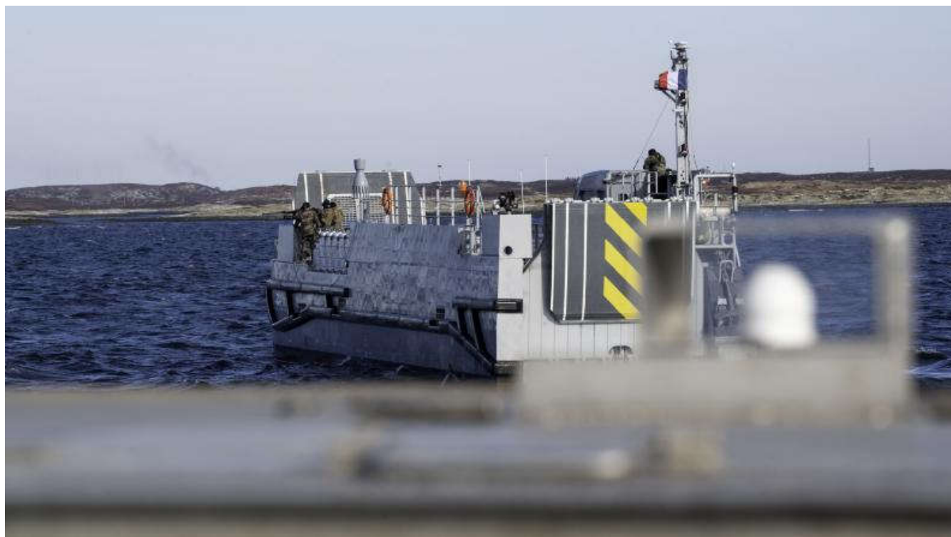
La Flottille amphibie parée au combat dans le Grand Nord -

Le 13 mars 2022, la batellerie du détachement de la Flottille amphibie embarquée à bord du PHA Dixmude , composée d'un EDA-R, d'un CTM et d'un EDA-S dont c'est le premier déploiement opérationnel, s'est entraînée aux tirs contre terre à la mitrailleuse 12.7 mm au large de l'île de Tarva en Norvège. Une séquence menée aux côtés des soldats du groupement tactique embarqué (GTE), inscrite dans la phase de montée en puissance de l'exercice COLD RESPONSE 22.