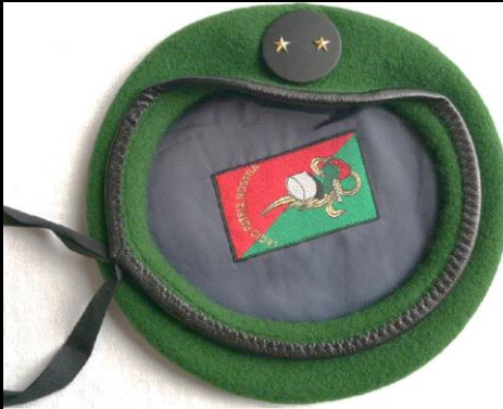
Béret général de brigade Légion Etrangère