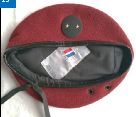
Béret général de Brigade 11° BP