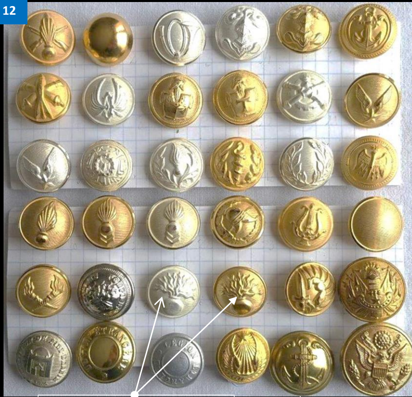
Gendarmerie départementale et mobile