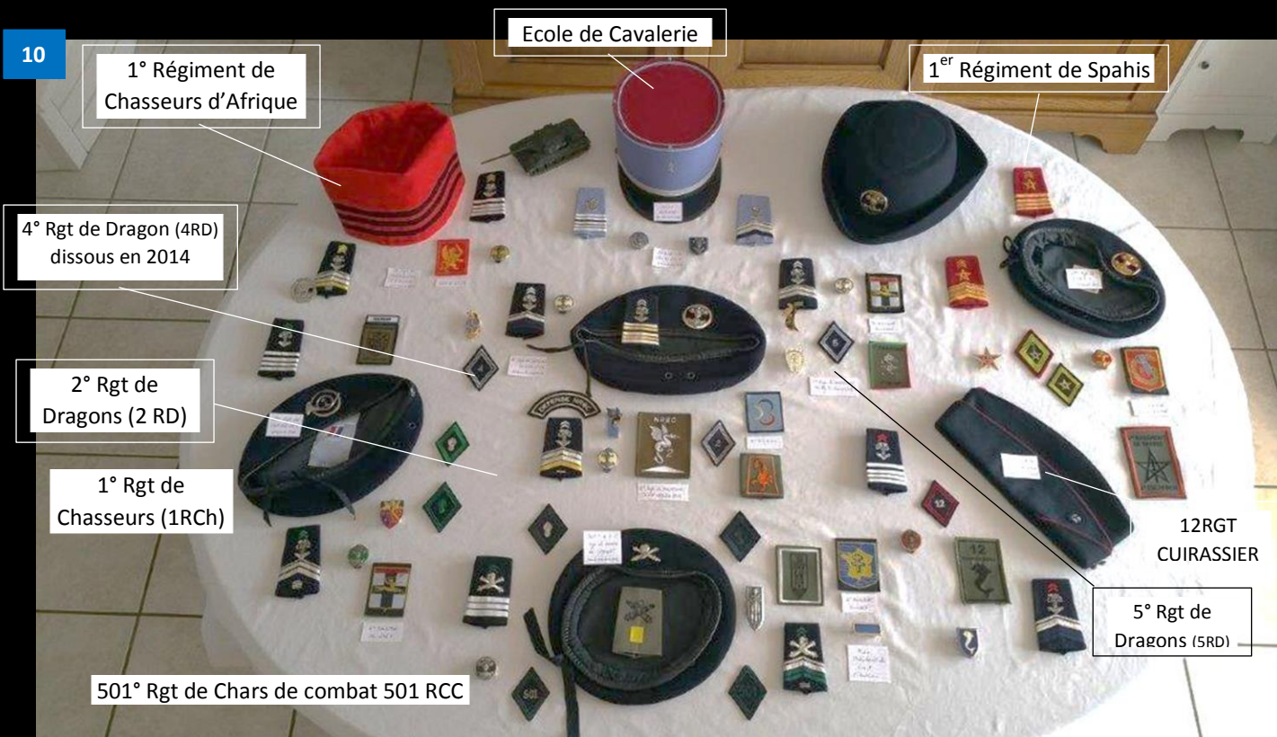
L'Arme blindée de cavalerie trouve ses racines dans l'histoire des troupes à cheval. Aujourd'hui l'ABC est l'arme des troupes motorisées et blindées de l'Armée de Terre.