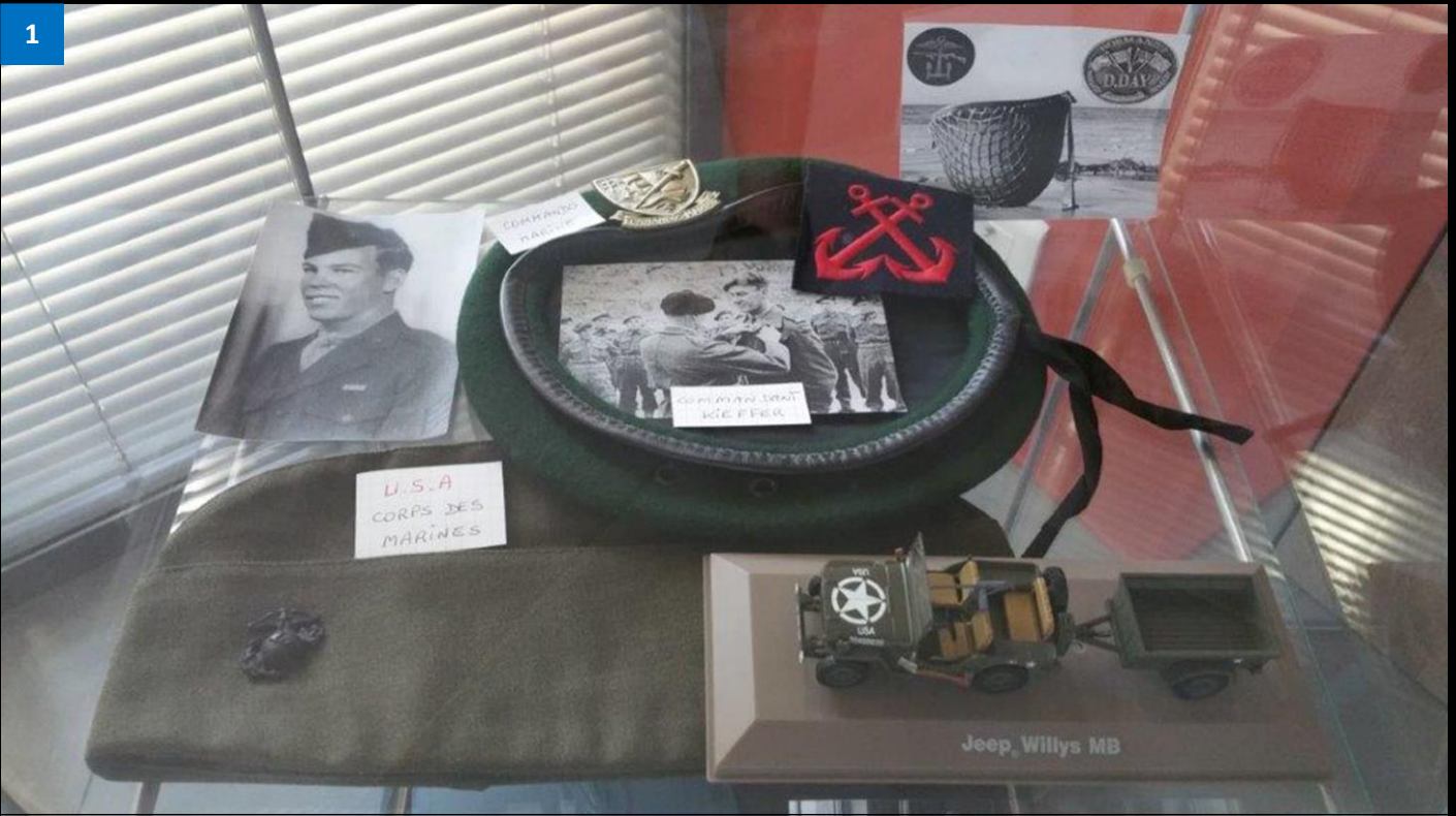
1 Calot du corps des Marines, Béret BFMC. Le commando 1 er bataillon des fusiliers marins commando a été créé au printemps 1942 en Grande Bretagne, il était commandé par le commandant Philippe KIEFFER. C'est le seul régiment français ayant participé au débarquement en Normandie avec 177 commandos, dont 20 perdirent la vie et 133 furent blessés au combat.