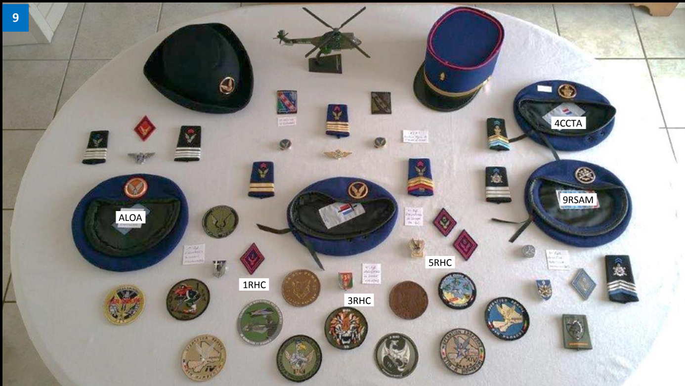
9 Coiffures de l'Aviation légère de l'armée de terre (ALAT) historiquement issue de l'artillerie dont elle était en 1952 les moyens aériens sous le nom d'ALOA « aviation légère d'observation d'artillerie ». L'ALAT devient une arme distincte de l'artillerie en 2003: 1RHC, 3RHC et 5RHC (Régiment Hélicoptère de Combat) , la 4° compagnie de commandement et de transmissions d'aérocombat (4° CCTA), ainsi que le 9° Régiment de soutien aéromobile (RSAM).