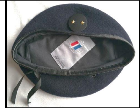
Béret général de Brigade