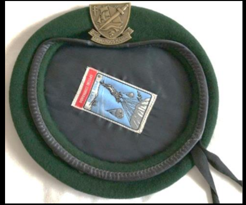
Béret contre-amiral commandos Marine