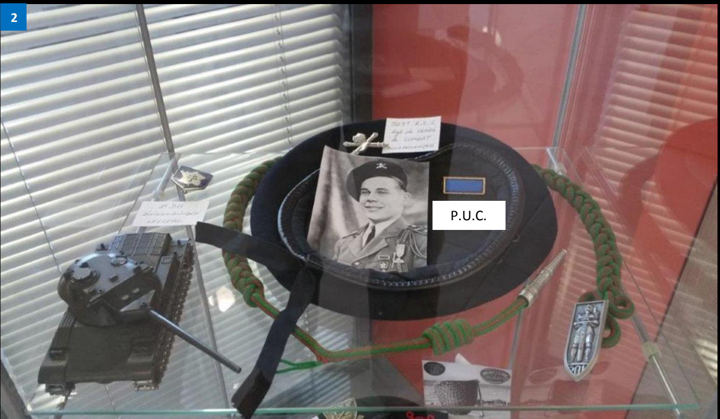
2 Béret du 501 e Régiment de Chars de Combat (RCC) de MOURMELON LE GRAND. Ce régiment a été recréé en 1943. Il a participé aux campagnes de la France libre. Puis à la libération de l'Europe au sein de la 2 e Division Blindée du général Leclerc. Il a reçu du commandement américain la « Presidential Unit Citation ».