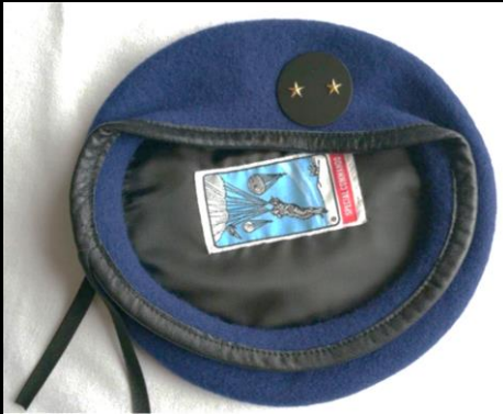
Béret général de brigade Alat