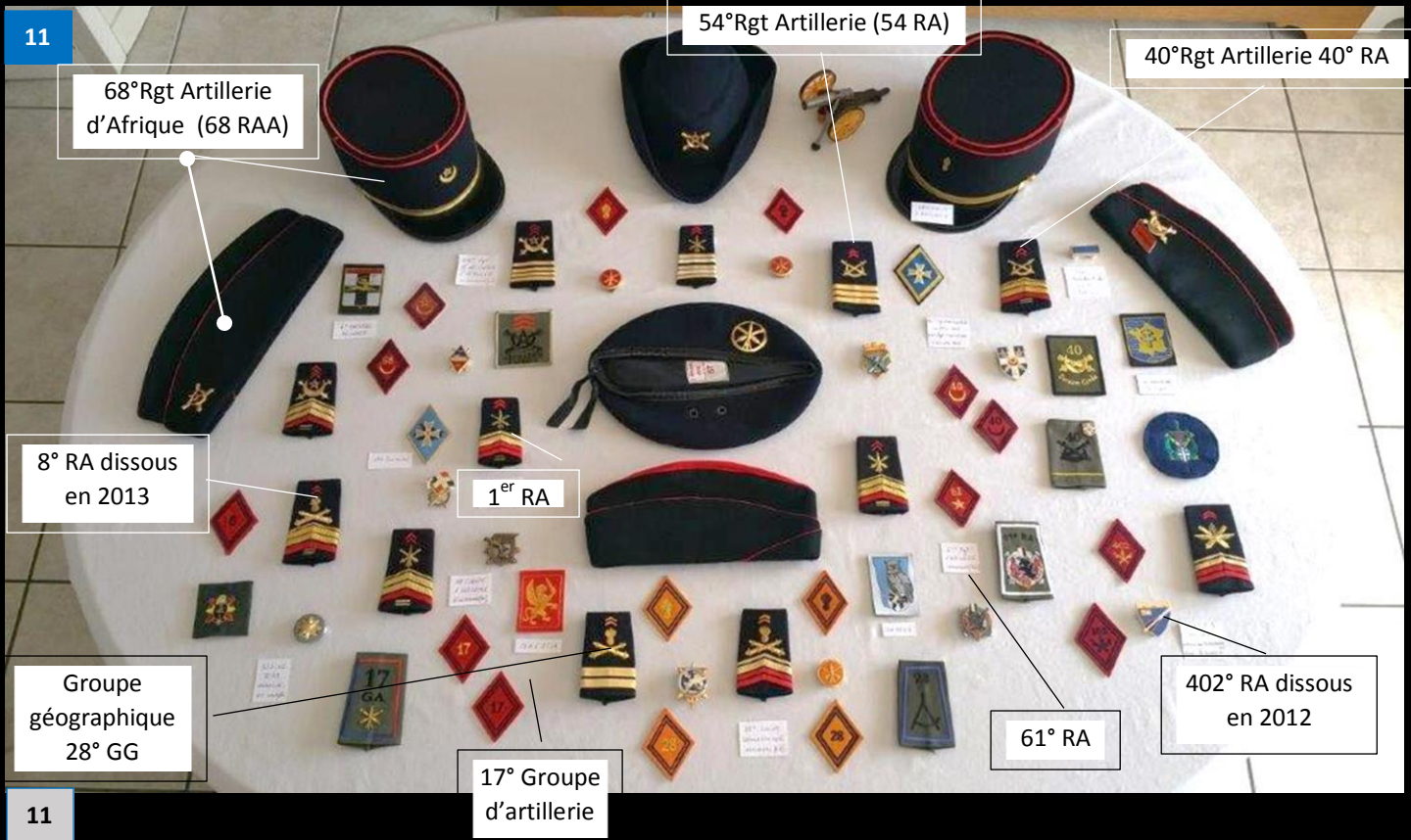
68°Rgt Artillerie d'Afrique (68 RAA)