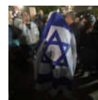
GAIA - DREUZ