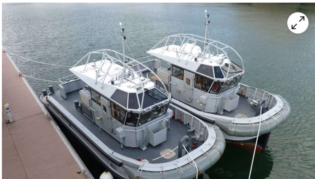
Les pousseurs « Loup » et « Sar » accostés au ponton de « La Recouvrance ».

Accostés au ponton de « La Recouvrance », au quai Malbert du port de commerce de Brest (Finistère), les pousseurs « Loup » (Y6032) et « Sar » (Y6033) ont été chargés sur le navire semi-submersible « Super Servant 4 », afin de rejoindre la base navale de Toulon (Var), où ils seront affectés.