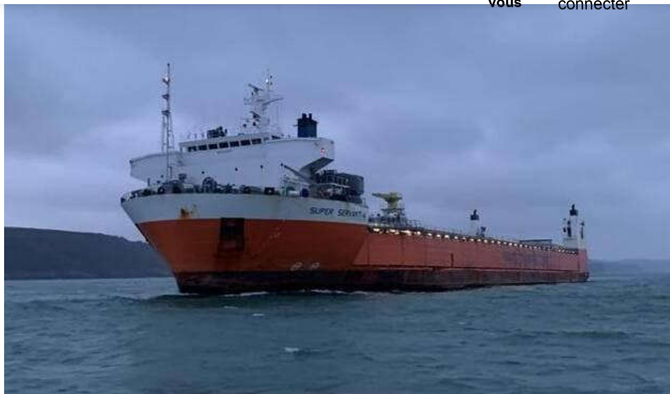
Le « Super Servant 4 », lors de son appareillage, jeudi 11 février 2021.