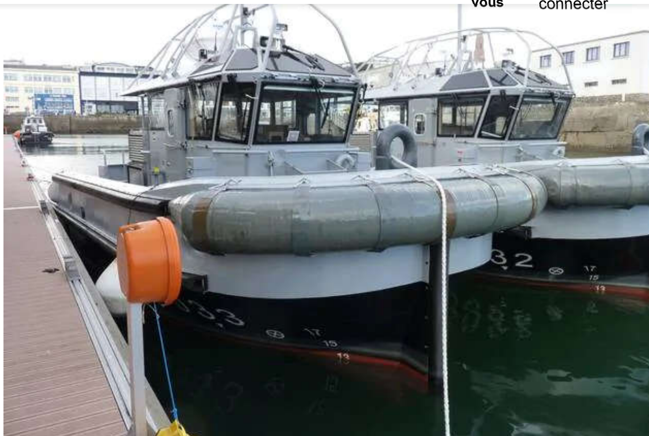
Les pousseurs « Loup » et « Sar » accostés au ponton de « La Recouvrance ».