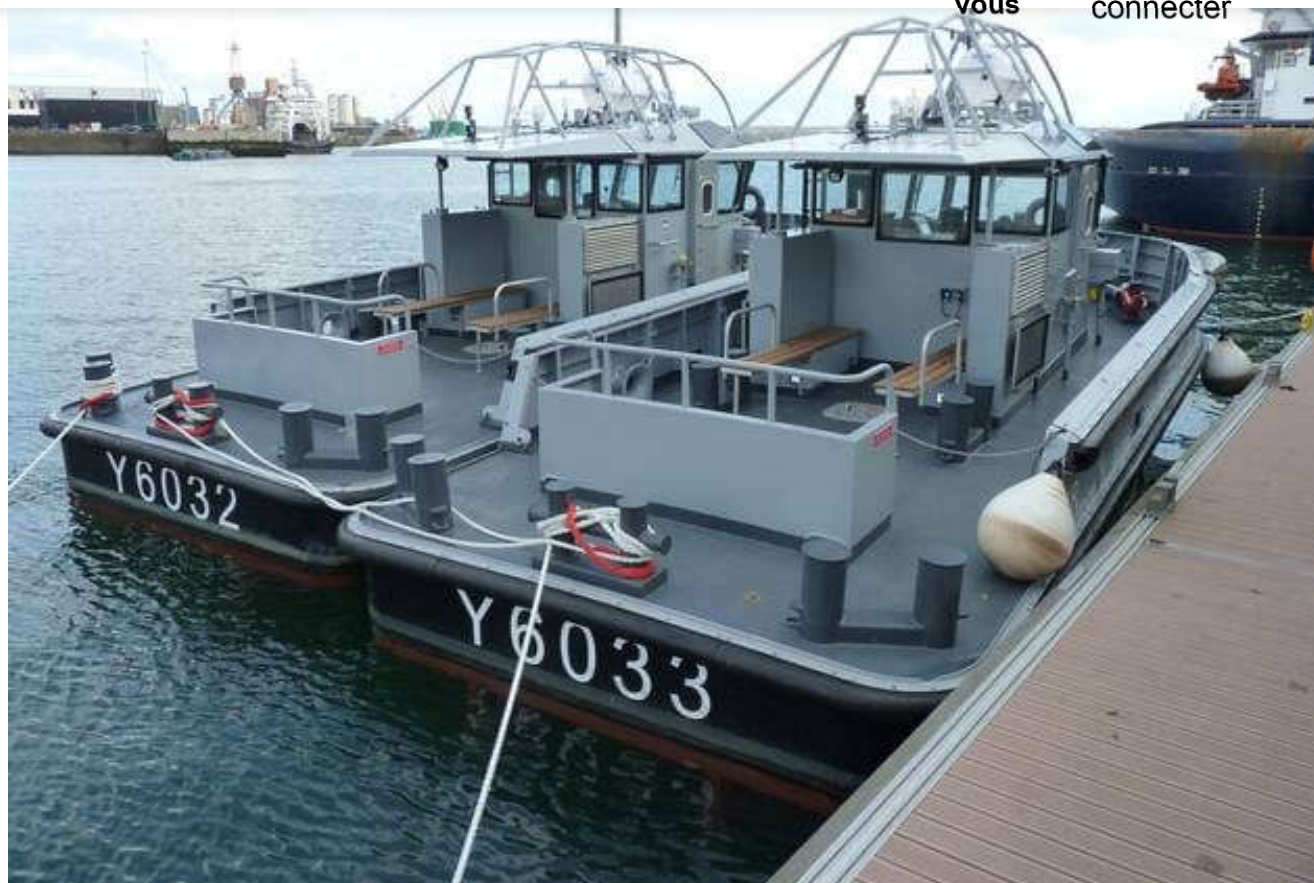
Les pousseurs « Loup » et « Sar » accostés au ponton de « La Recouvrance ».