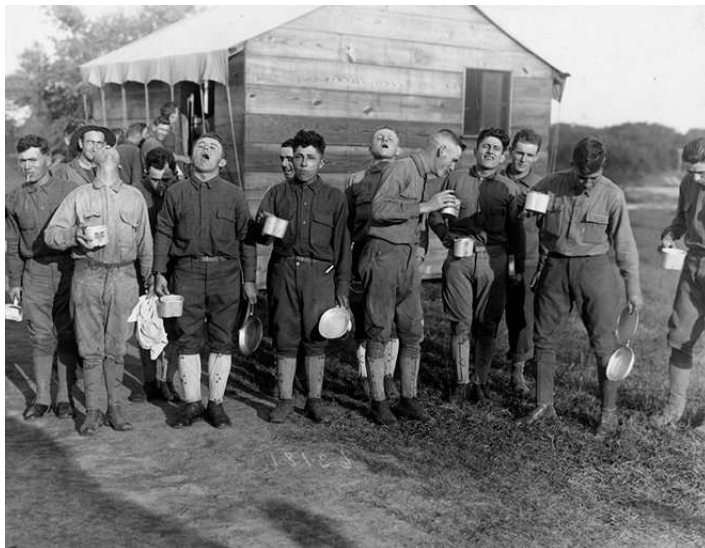
Camp Dix, New Jersey. Des soldats se gargarisent avec de l'eau salée en prévention de la grippe.