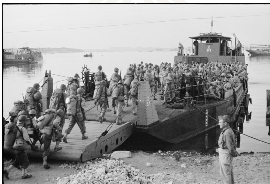
Troupes françaises embarquant pour les côtes de Provence, photo ECPAD.

Général Dominique Cambournac Délégué au Patrimoine de l'armée de Terre