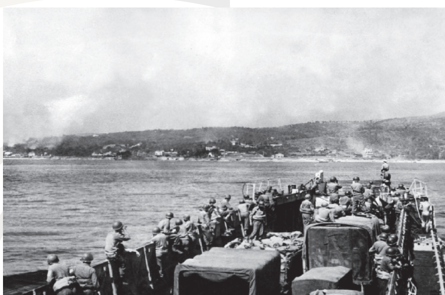
Troupes françaises en direction des côtes de Provence, photo ECPAD.