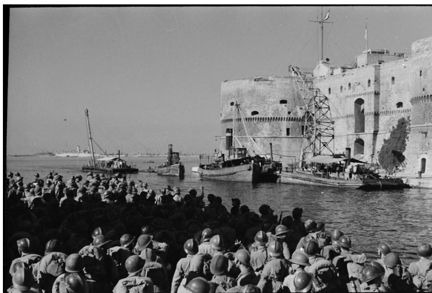
Troupes françaises attendant d'embarquer pour les côtes de Provence, photo ECPAD.

Longtemps retardé, parfois annulé, le « second débarquement » permet finalement aux soldats, marins et aviateurs français d'entrer de plain-pied dans la bataille de France, d'offrir aux Américains le port dont ils ont besoin et d'obtenir l'évacuation ou la libération de plus de la moitié du territoire national.