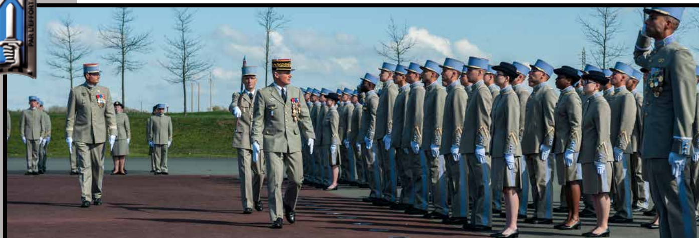
Le général COMENSOA passe les élèves sous-officiers en revue

Forte de ses quatre bataillons d'élèves et de sa compagnie de perfectionnement, l'ENSOA poursuit avec détermination, volontarisme et enthousiasme la mission qui lui fut confiée il y a plus de 50 ans, au service de la France et de l'excellence de son armée de Terre.