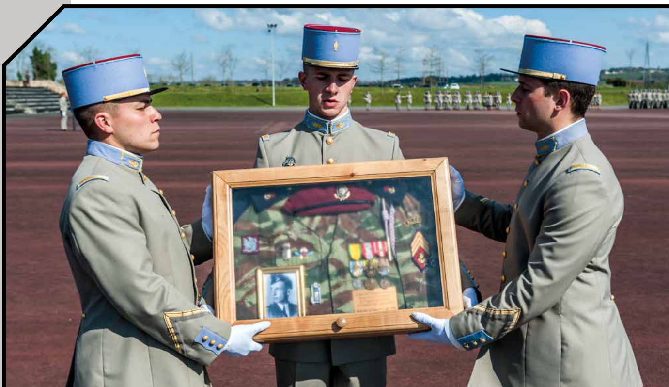
Les ENSOA présentent le reliquaire de la promotion SCH Constantin de Magny

Ces différents moments se sont caractérisés par la rigueur de leur préparation et l'enthousiasme de la promotion. Nous avons pris rendez-vous pour le 4 juillet, à l'occasion de leur remise de galon de Sergent, qui sera suivie par notre AG 2019.