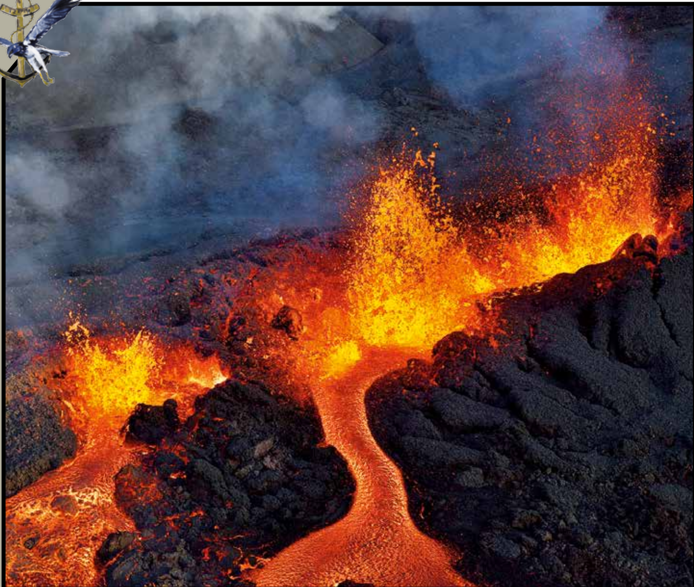
Eruption du Piton de la fournaise en mars 2019.

Nous vous les présentons dans les pages qui suivent, à l'instar de notre volcan qui continue de faire son spectacle après 20 jours d'éruption (coulées visibles depuis la route des laves RN 2). Mais en plus, je vous propose de faire connaissance de la langue « créole », en vous offrant un petit lexique.