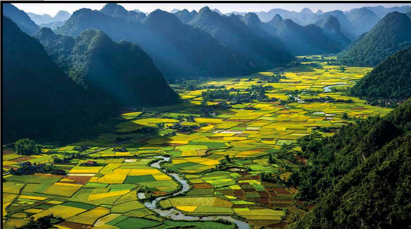
Vallée de Bac Son

Nous venons d'effectuer une interminable traversée maritime de 40 jours au départ de Marseille, à bord du transport de troupe le « Sontay » qui a fait escale à Port Saïd, Djibouti, Pondichéry, Colombo .... Nous rejoignons mon père arrivé quelques mois plus tôt dans cette Indochine surnommée à l'époque " la perle de l'Empire ".