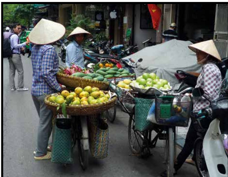
Marchandes de légumes et de fruits

Je quitte le Vietnam en 1950, quelques souvenirs me reviennent encore en mémoire, en vrac : le cyclo pousse pour aller à l'école, la visite du magnifique temple d'Angkor Vat au Cambodge voisin, les tirs des viets à la nuit tombée dans les rizières proches de notre maison un peu isolée, les coassements des crapauds buffles, mes animaux (singe, perroquet vert, canard blanc) sans oublier les deux jeunes Bérêts Rouges (des Normands) du 2 e BCCP que mes parents recevaient lors de leurs brèves permissions... Je conserve pieusement leur insigne « à la