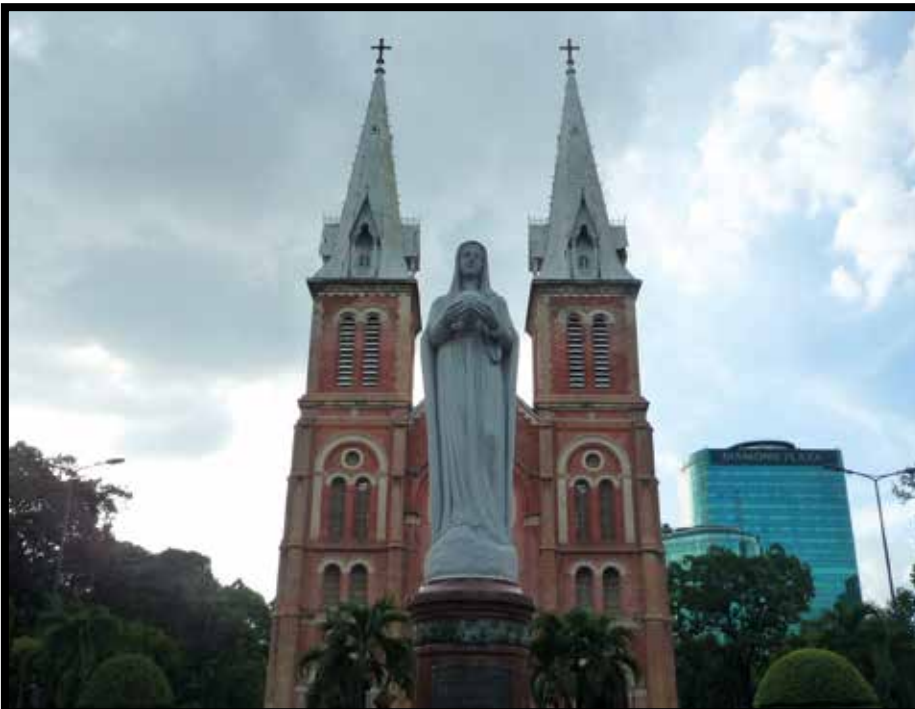
La cathédrale de Saïgon