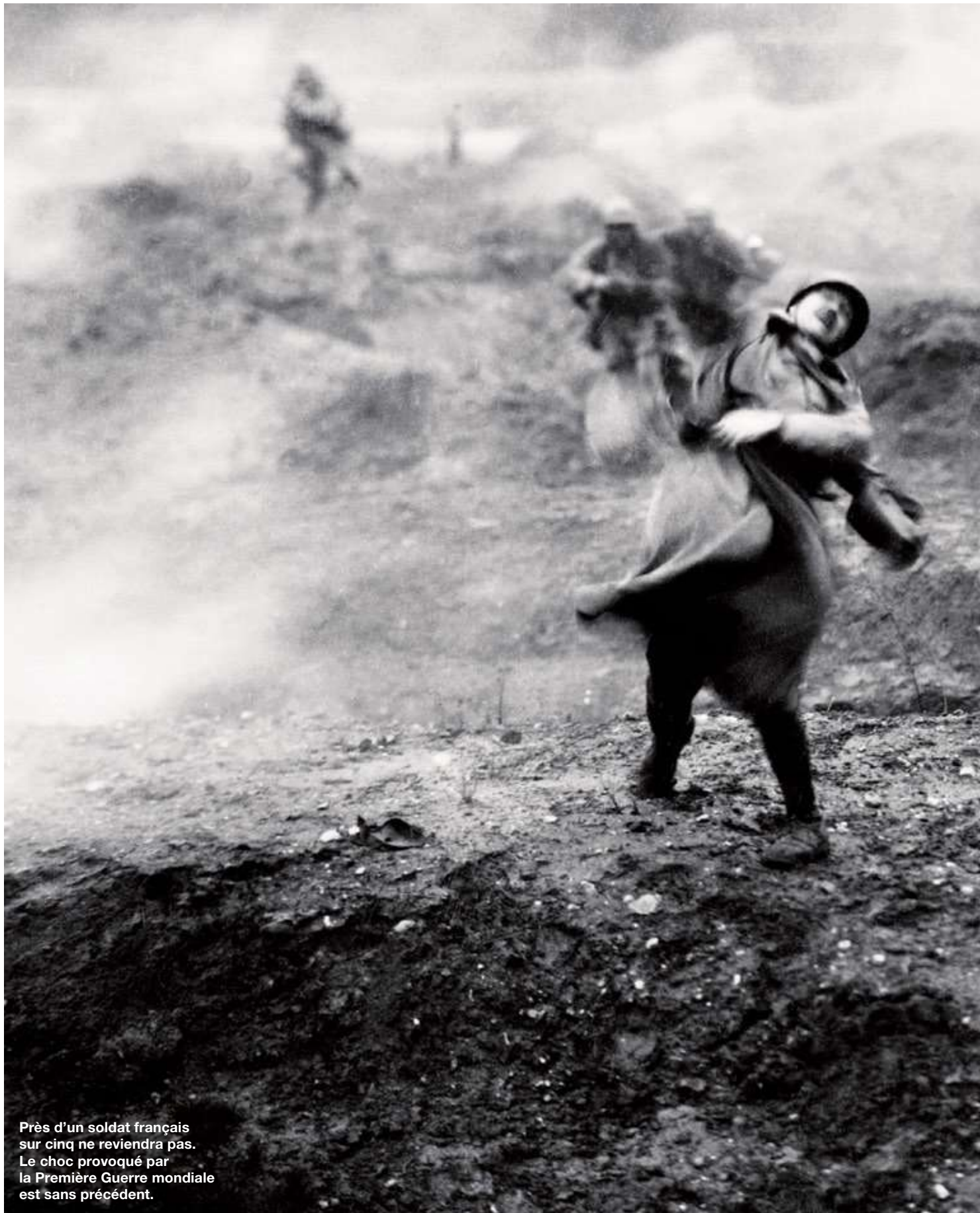
Près d'un soldat français sur cinq ne reviendra pas. Le choc provoqué par la Première Guerre mondiale est sans précédent.