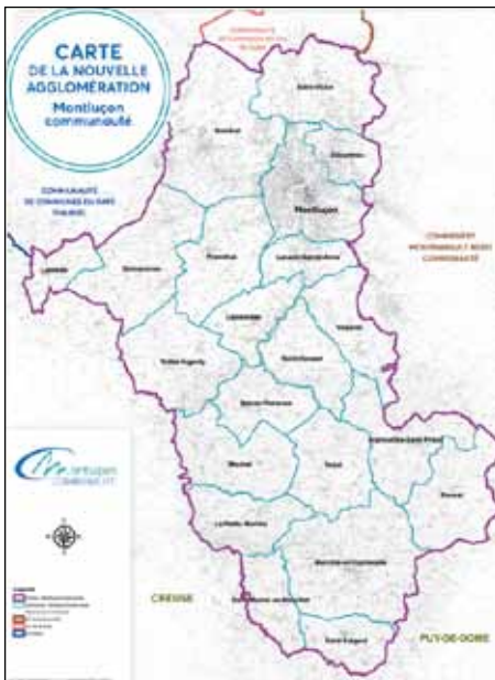
Ensemble du territoire de Montluçon Communauté

TERRITOIRE Cette année marque une étape majeure dans le développement de la pratique intercommunale. Exit, la Communauté de l'Agglomération Montluçonnaise, bienvenue à Montluçon Communauté. Désertines Infos revient sur les compétences de la Communauté.