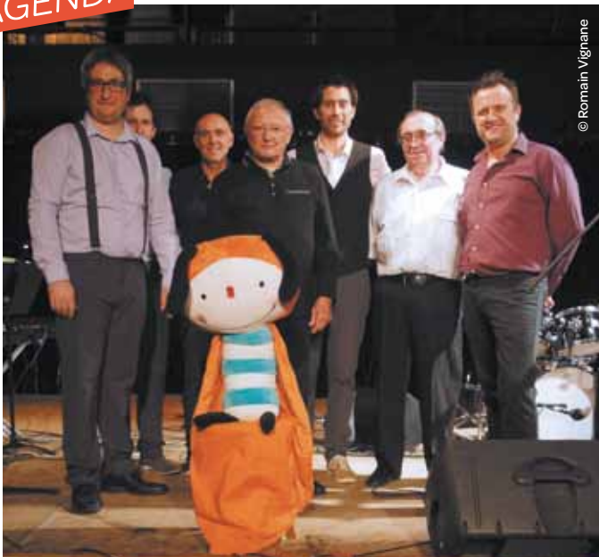
Concert à Germinal organisé par l'ASEM au profit des enfants malades