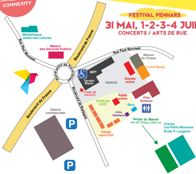
Illustration et graphisme : gwendalbric.com

FESTIVAL PENHARS 31 MAI, 1-2-3-4 JUIN CONCERTS / ARTS DE RUE