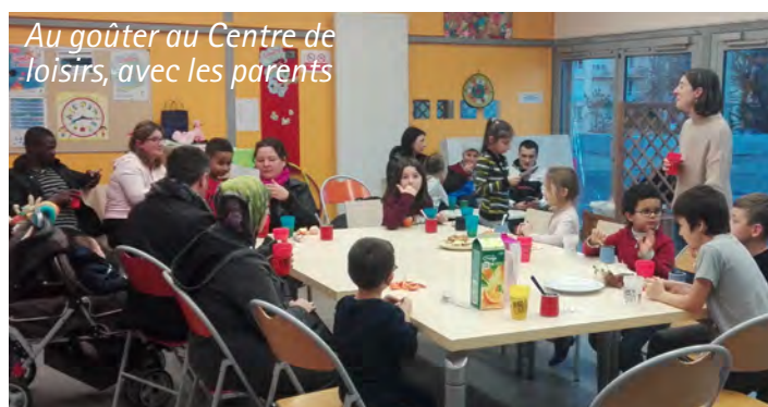
Au goûter au Centre de loisirs, avec les parents