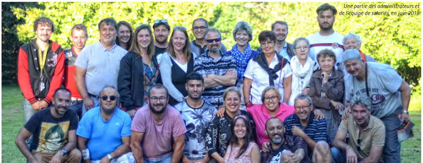
Une partie des administrateurs et de l'équipe de salariés, en juin 2018

Nous accueillons toujours avec bonheur les candidats au conseil d'administration et les bénévoles qui veulent se réaliser et donner un peu de leur temps et de leur savoir. C'est pour cela que j'invite les adhérents, anciens et nouveaux, à venir participer à cette dynamique en tant que membres du CA, des commissions ou du bureau.