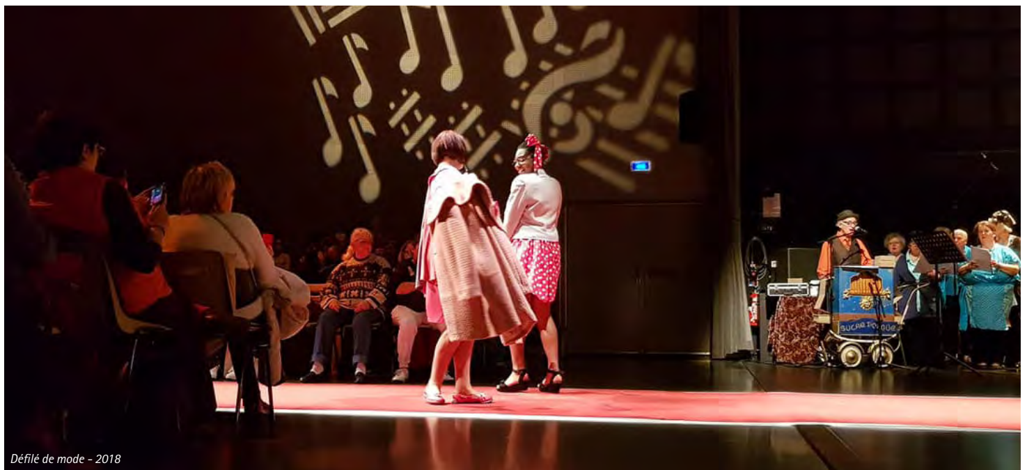
Défilé de mode - 2018

Nous espérons que ce changement n'aura pas de conséquences sur nos relations avec les partenaires (dont certains bénéficieront en 2019 d'une aide de la ville compensatoire) et que la programmation artistique du Terrain Blanc restera variée et ambitieuse !