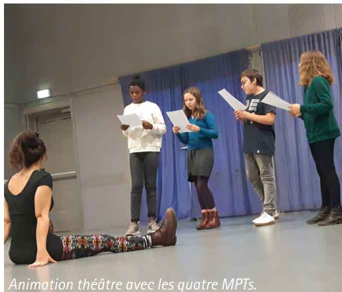
Animation théâtre avec les quatre MPTs.

Ce nouvel accueil développe la polyvalence au sein de l'équipe d'animation et permet aux enfants de rencontrer l'ensemble des animateurs.