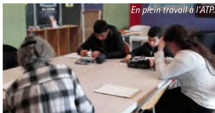
En plein travail à l'ATP