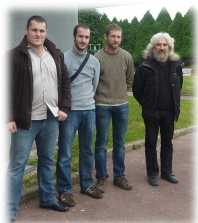
Les champions d'Europe 2011 et leur coach