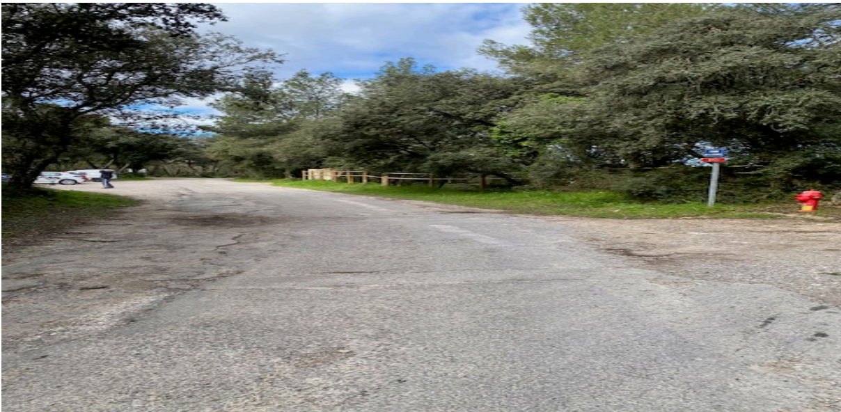
Vue du Château de Roquemartine