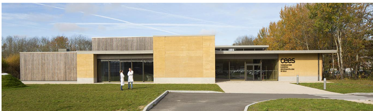
Le Conservatoire européen des échantillons de sols

Les échantillons de la campagne RMQS2 sont réceptionnés et préparés par le Conservatoire européen des échantillons de sols dont les locaux sont situés sur le centre INRAE Val de Loire (site d'Orléans).