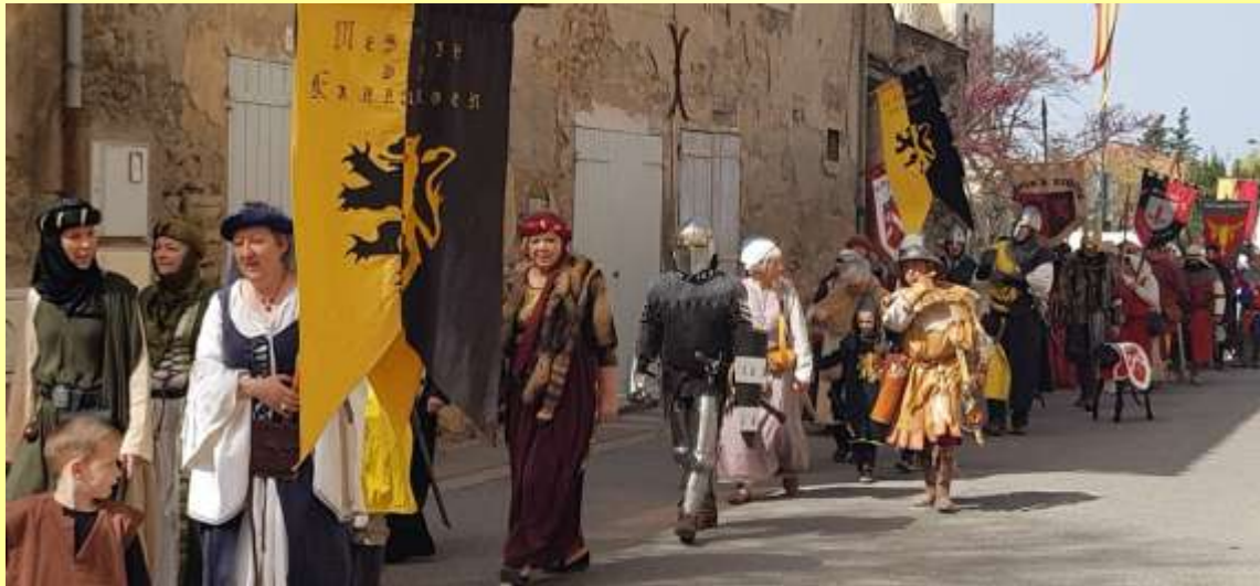
La Mesnie de Kallungen en procession