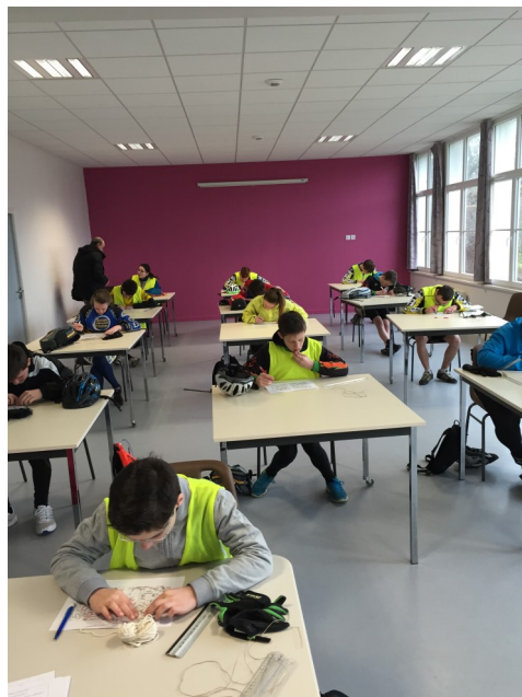
Au critérium, il faut la tête et les jambes

Le comité départemental remercie la commune de PLESLIN et le club de PLESLIN pour leur engagement et les récompenses qu'ils ont offert.