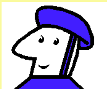
Philippe s'en pose aussi