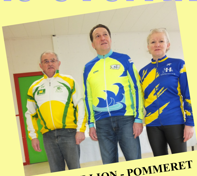
Fusion HILLION - POMMERET