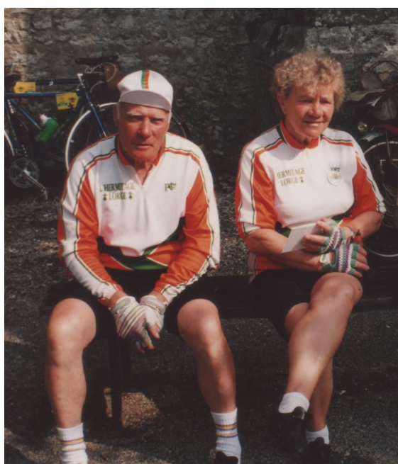
Semaine fédérale 1994