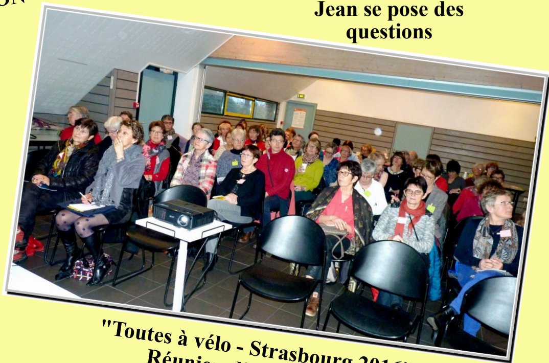
"Toutes à vélo - Strasbourg 2016" Réunion d'information