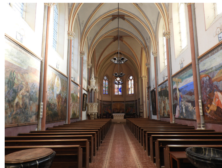
Eglise Saint-Aubin (XIXe siècle) et toiles d'Adelyne Neveux. (Chambellay)