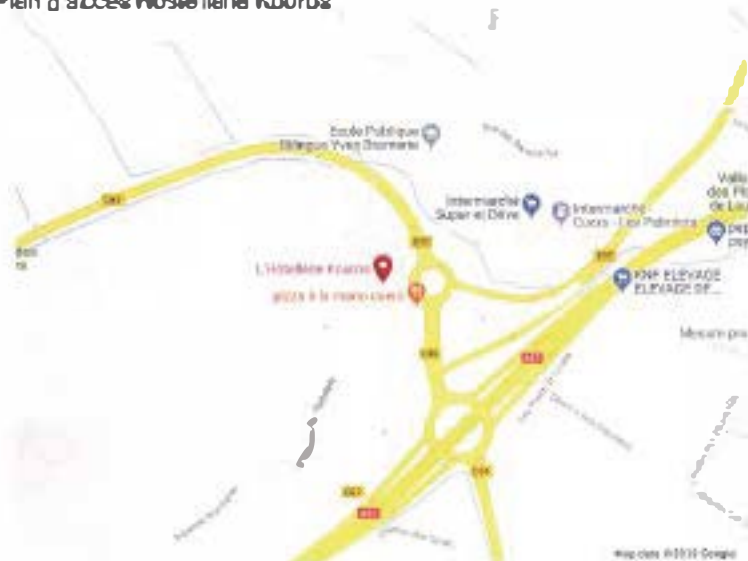
Plan d'accès Hostellerie Kouros