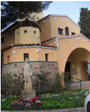
Eglise Ste. Thérèse