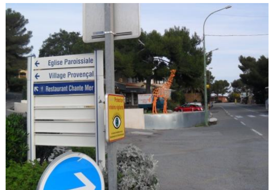
Route de bord de mer, bifurcation vers l'Eglise