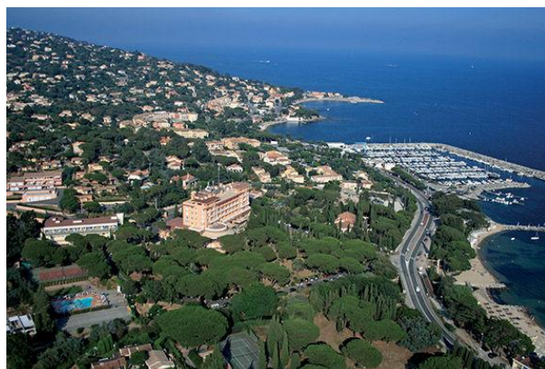
San Peire les Issambres