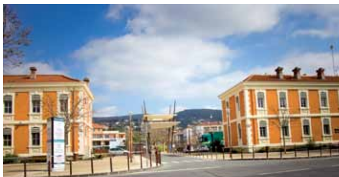
La Pépinière-Hôtel d'Entreprises - Espace Chabran - Draguignan