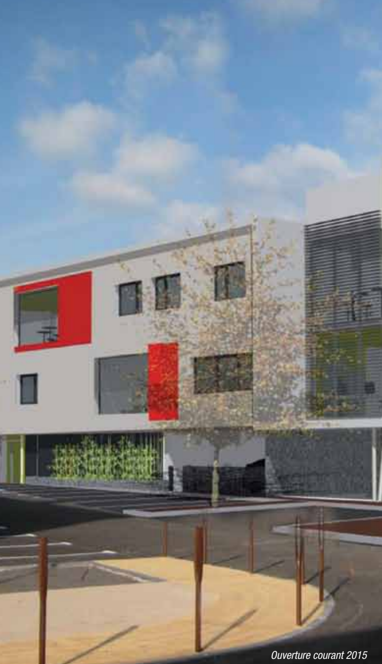
Ouverture courant 2015