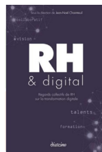
Auteur de l'ouvrage : « RH & Digital »

On parle beaucoup du travail de demain mais si nous étions déjà en retard ? De nouvelles formes de contrat, d'outils et d'usages ont bouleversé nos méthodes et nos environnements de travail. Comment peut-on gérer ces nouveaux employés ? Comment devenir un nouvel employeur de choix ? Quels sont les premiers pas à faire pour vivre (et non plus subir) les transformations digitales ?