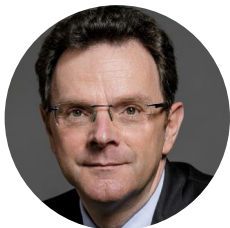
Frédéric MOTTE, Président MEDEF Hauts-de-France

« Comment les entreprises s'adaptent aux nouveaux modes de travail »