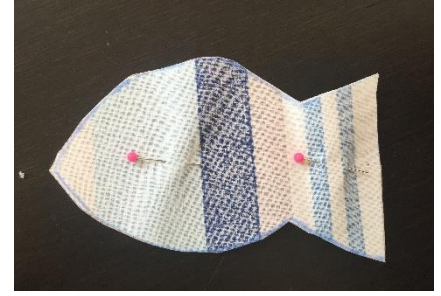
Découper les 2 épaisseurs de tissu en suivant la forme