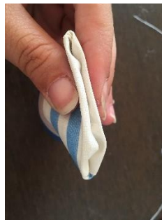
Rentrer les tissus vers l'intérieur et piquer pour fermer le trou