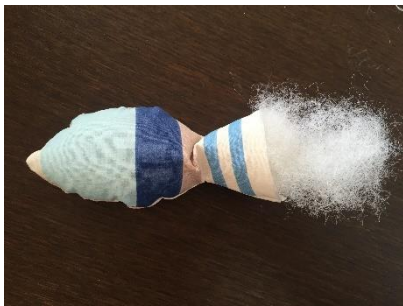
Remplir avec de la ouate