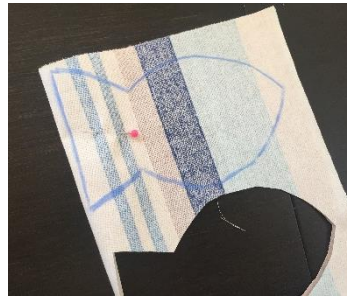
Dessiner la forme sur l'envers du tissu plié en 2