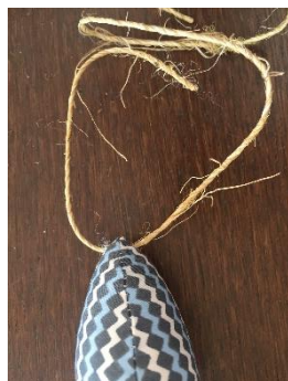
Assembler avec de la cordelette