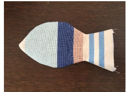
Retourner à l'endroit en poussant bien la couture