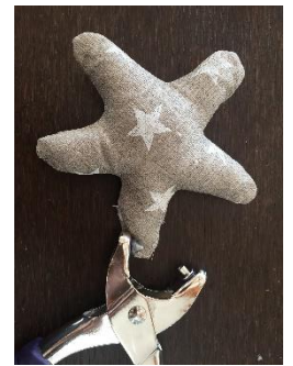
Perforer l'étoile et les poissons