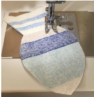
Piquer tout le tour, laisser ouvert la queue du le poisson et une branche de l'étoile