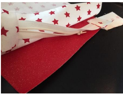
Positionner ensuite la doublure.