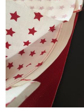
Faire le 2 ème côté de la même façon. Tissus endroit contre endroit, fermeture entre les 2 tissus, curseur en contact avec tissu extérieur. Piquer puis faire la surpiqure .