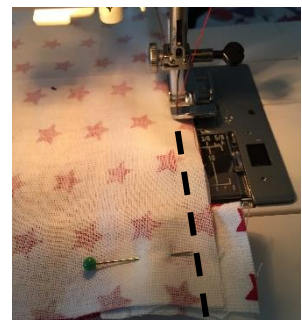
Piquer en point droit le long de la fermeture.