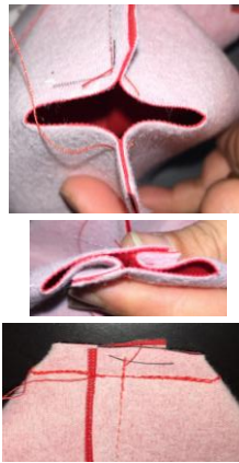
Rabattre les 4 angles et piquer en point droit.