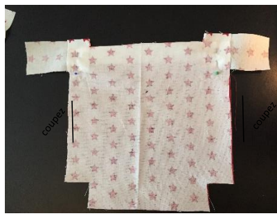
Couper les excédents de tissu des pattes.