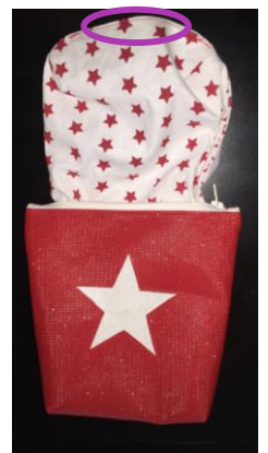
Fermer ensuite le trou de la doublure par un point droit.