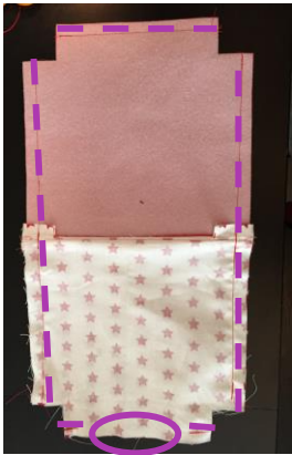
Tissu extérieur endroit contre endroit, doublure endroit contre endroit. Coudre le tour en point droit sauf les angles et le bas de la doublure.