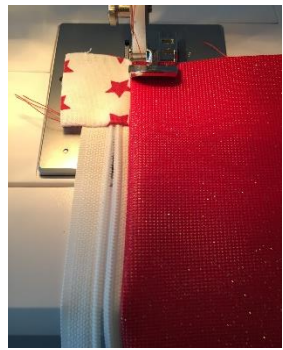
Piquer en point droit le long de la fermeture pour faire une surpiqure.