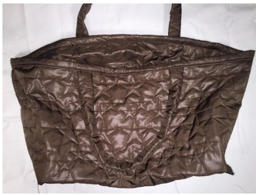
Voici le résultat.