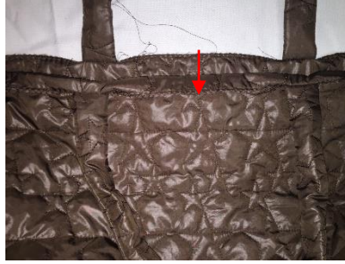
Faire un revers puis un second.