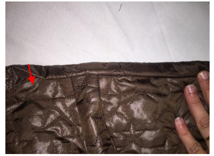
Laisser les anses dans le revers.