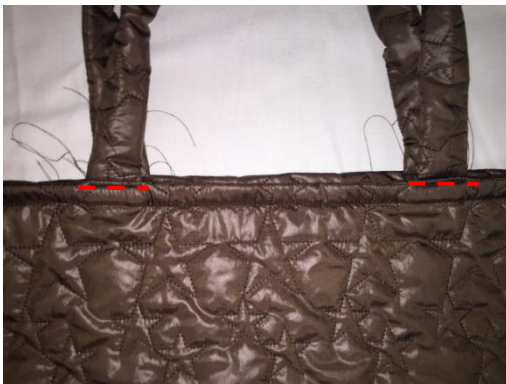
Piquer chaque anse pour les renforcer et les maintenir vers le haut.