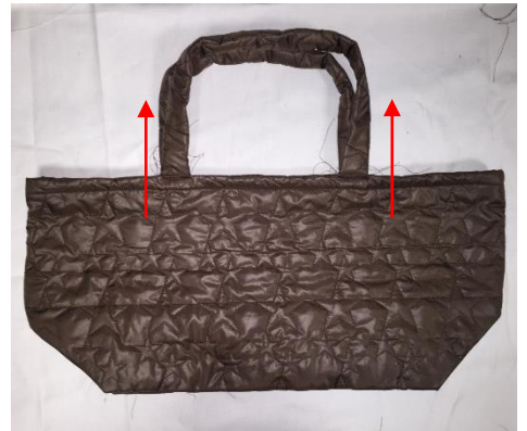
Retourner votre sac à l'endroit. Tirer les anses vers le haut.