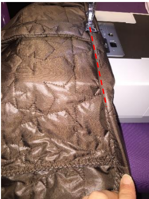
Piquer tout le tour.