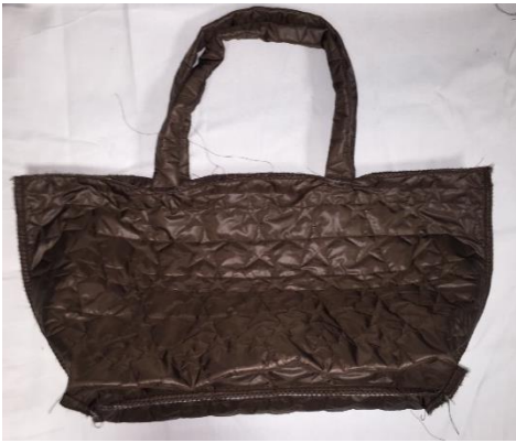
Laisser le sac à l'envers.