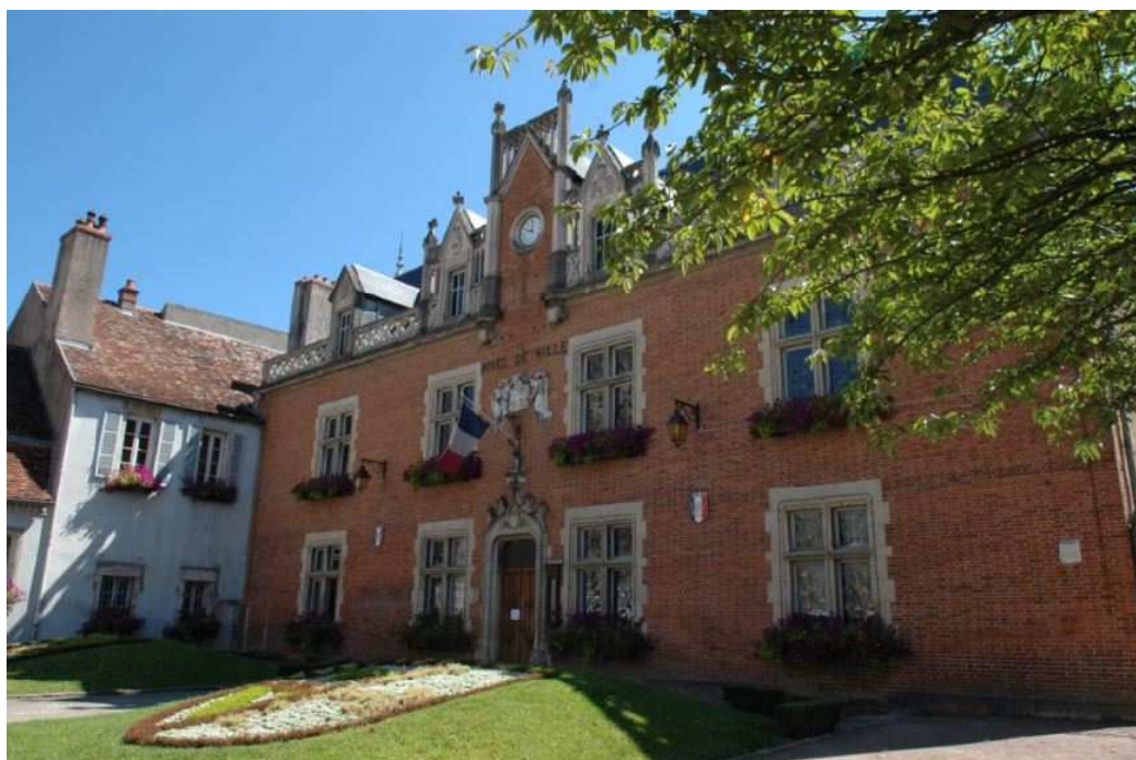
L'ancien Logis des Ducs de Bourgogne, aujourd'hui Hôtel de Ville, est un bâtiment en briques du 15 e siècle, sa façade a été restaurée au 19 e siècle.