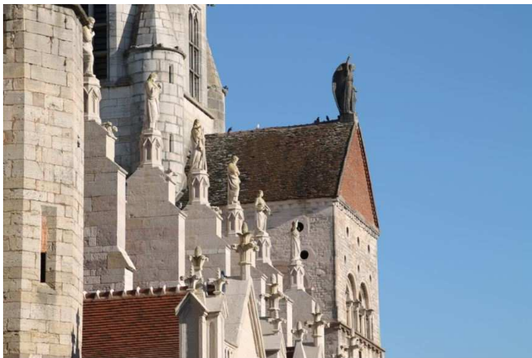
Eglise Notre Dame, construite entre le XIII et XIV ème siècle.