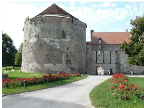
Un patrimoine ignoré

Mais heureusement, il reste les touristes étrangers et leurs beaux bateaux. Passez au port, à pied par la voie bleue ou verte et admirez les 150 merveilles et comptez les plaques d'immatriculations françaises des véhicules stationnés sur le parking. Vous ne trouverez que des véhicules belges, de Grande-Bretagne, hollandais, suisses, luxembourgeois, néo-zélandais, australiens... Pour rassurer toute cette belle clientèle, la société H2O eu une idée géniale : installer au milieu du port un système de caméras de surveillance. Chacun, même au bout du monde, devant son ordinateur peut surveiller son embarcation. Formidable, non ? Le Barrage, conçu par l'ingénieur Poiré, l'un des plus longs à aiguilles, a été automatisé en 2011 et ce bel ouvrage conservé, reste visible depuis le belvédère sur la Saône, situé avenue de la Gare.