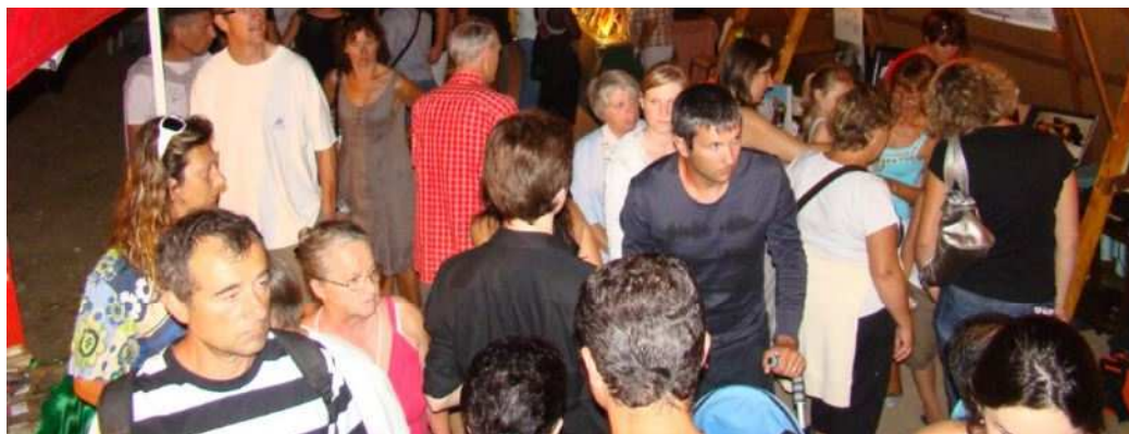
Les Marchés Nocturnes ont lieu en été, produits régionaux, du terroir, de l'artisanat, animations culturelles et/ou sportives !